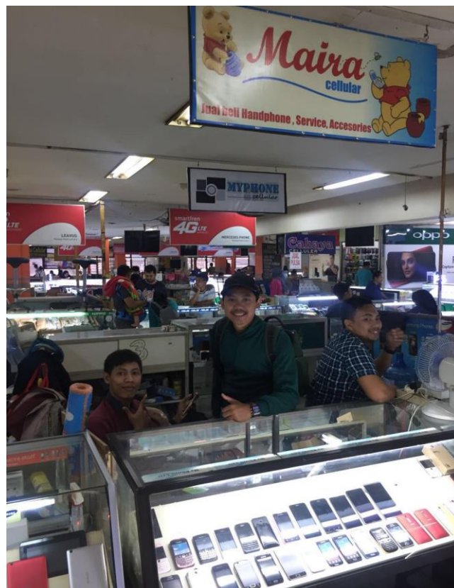
Gambar 7: Foto Penulis dengan Pelaku Usaha di Malang Plaza