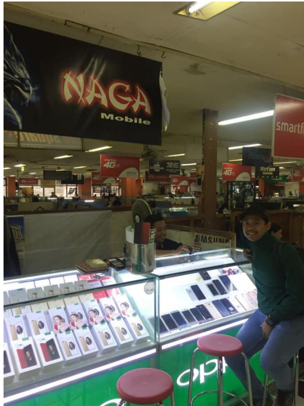
Gambar 8: Foto Penulis di depan salah satu konter di Malang Plaza (Pelaku Usaha)