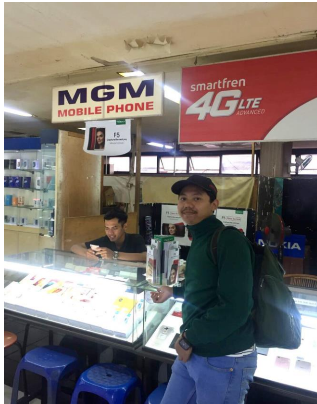
Gambar 6: Foto Penulis di depan salah satu konter di Malang Plaza (Pelaku Usaha)