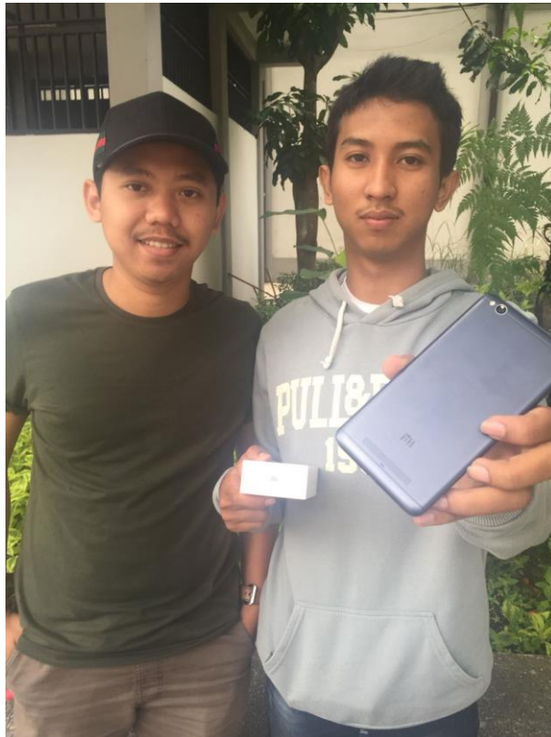
Gambar 11 : Foto Penulis dengan salah satu konsumen handphone Xiaomi bergaransi Distributor di Kota Malang