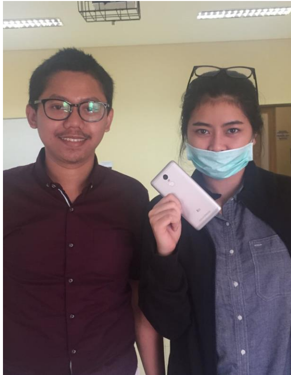
Gambar 12 : Foto Penulis dengan Konsumen handphone Xiaomi bergaransi distributor di Kota Malang