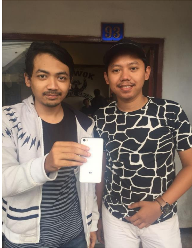
Gambar 10 : Foto Penulis dengan salah satu konsumen handphone Xiaomi bergaransi Distributor di Kota Malang