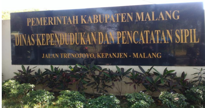
Gambar 4 : Dinas Kependudukan dan Pencatatan Sipil Kabupaten Malang