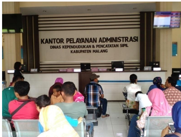
Gambar 6 : Ruang Tunggu Pelayanan