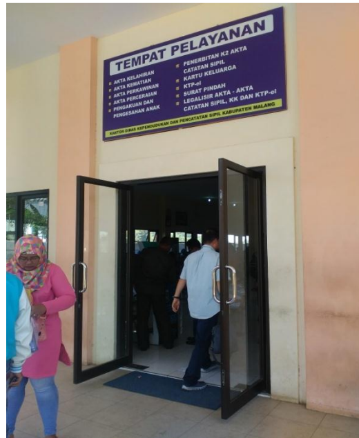
Gambar 7 : Pintu Masuk Dinas Kependudukan dan Catatan Sipil Kabupaten Malang