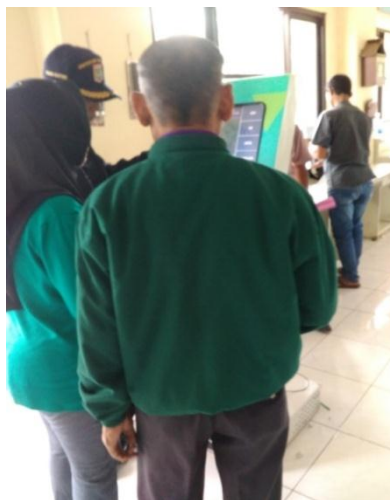
Gambar 8: Masyarakat Mengambil Nomor Antrian Layanan

Semua bidang layanan tidak dapat dipisahkan satu sama lain karena sesuai tugas dan fungsi dari dinas tersebut. Agar masyarakat tidak kebingunan di pintu utama disediakan alat yang dapat mengeluarkan nomor antrian sesuai dengan loket yang ingin didatangi oleh masyarakat.