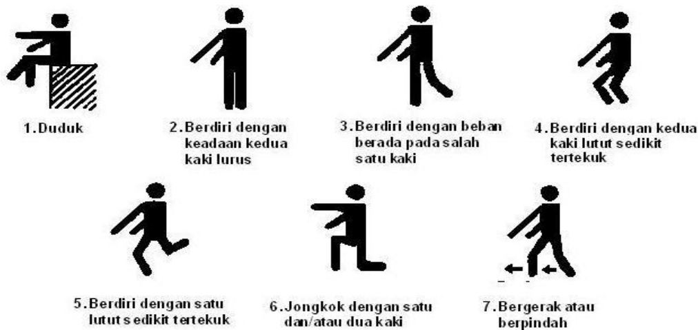
Gambar 2.3 Penilaian pada kaki ( leg )

c. Penilaian pada kaki ( legs ) diberikan nilai 1 – 7