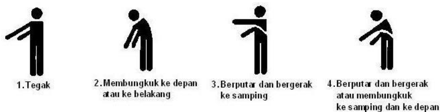
Gambar 2.1 Penilaian pada punggung ( back )