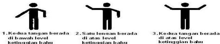
Gambar 2.2 Penilaian pada lengan ( arm )