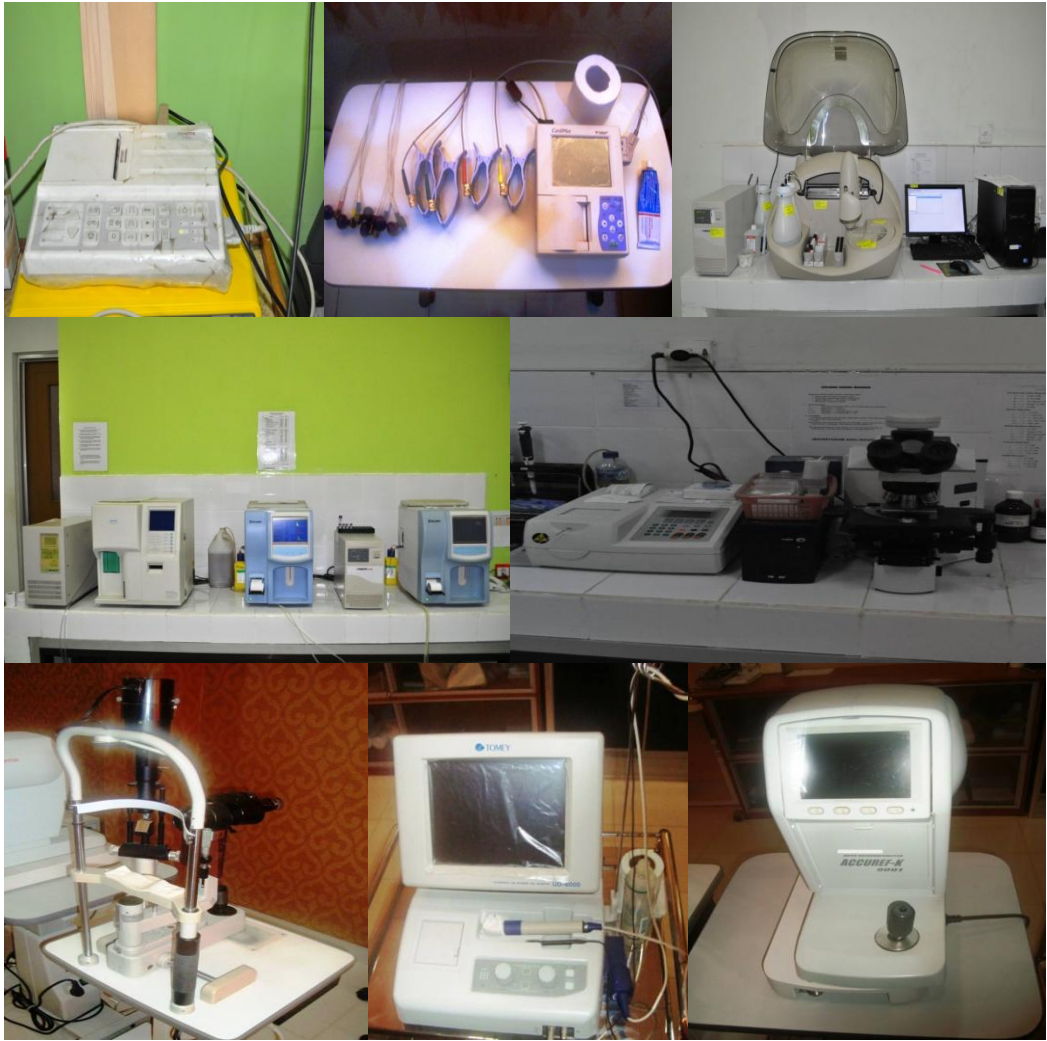
➤ Beberapa foto peralatan medis yang ada di RSUD Kabupaten Kutai Timur