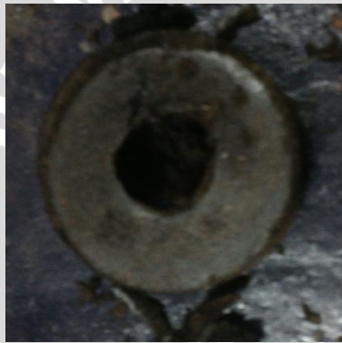
Tekanan 20 MPa