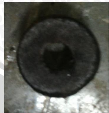
Tekanan 15 MPa