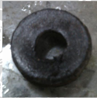
Tekanan 25 MPa