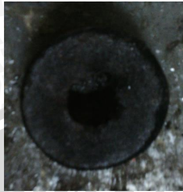
Tekanan 10 MPa