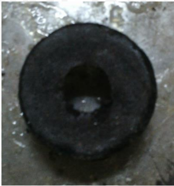
Tekanan 5 MPa

Foto Hasil Briket dengan Pemberian Tekanan yang Berbeda-beda