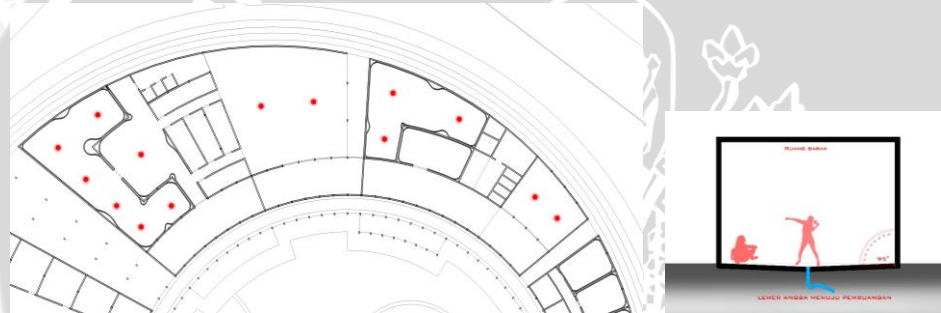
Gambar 5 Implementasi Kriteria Desain urinoir Barak Psikitik Sumber Analisa Pribadi 2016

Pada gambar 5 Barak Gelandangan Psikitik juga harus memperhatikan sistem pembuangan, karena dikhawatirkan penghuni yang merupakan individu yang mengalami gangguan kejiwaan akan sulit untuk diarahkan. Sehingga disiapkan saluran pembuangan di dalam barak berupa urinoir pada lantai. Lantai akan diberikan sudut kemiringan sehingga nantinya kotoran-kotoran dari psikitik dapat langsung dibuang dan mudah dibersihkan.