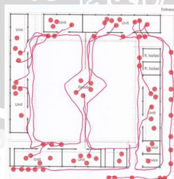
Gambar 2 Analisa pergerakan pada Barak Gelandangan Psikotik Pria di Liponsos Keputih

Tujuan dari mengamati pergerakan adalah mengetahui pola-pola atau jalur kegiatan PMKS yang terus berulang. Pengulangan pergerakan yang dilakukan seseorang biasanya dikarenakan suatu alasan tertentu. Jika kita mengetahui alasan tersebut, akan lebih mudah mengetahui spot-spot tertentu yang dibutuhkan bagi PMKS.