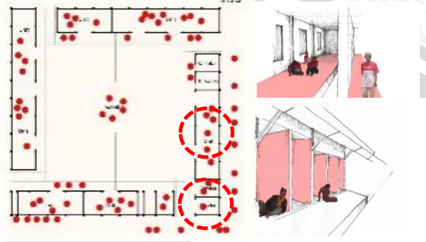
Gambar 3 Analisa psikologis pada Barak Gelandangan Psikotik Pria di Liponsos Keputih

Pengamatan psikologis disini berfokus pada keadaan internal PMKS di dalam barak. Setiap jenis PMKS akan memperlihatkan kondisi kejiwaan tertentu saat mereka berada pada tempat atau setting tertentu. Misalnya, rasa bosan berada di dalam barak, rasa takut terhadap petugas, rasa tidak nyaman terhadap ruang dan lain sebagainya. Tujuannya adalah mengetahui tingkat kenyamanan setting ruang terhadap PMKS yang diwadahi.