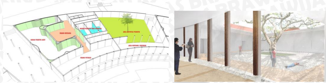
Gambar 4 Implementasi Kriteria Desain terhadap Barak Psikitik

Pada gambar 5 Barak Gelandangan Psikitik juga harus memperhatikan sistem pembuangan, karena dikhawatirkan penghuni yang merupakan individu yang mengalami gangguan kejiwaan akan sulit untuk diarahkan. Sehingga disiapkan saluran pembuangan di dalam barak berupa urinoir pada lantai. Lantai akan diberikan sudut kemiringan sehingga nantinya kotoran-kotoran dari psikitik dapat langsung dibuang dan mudah dibersihkan.