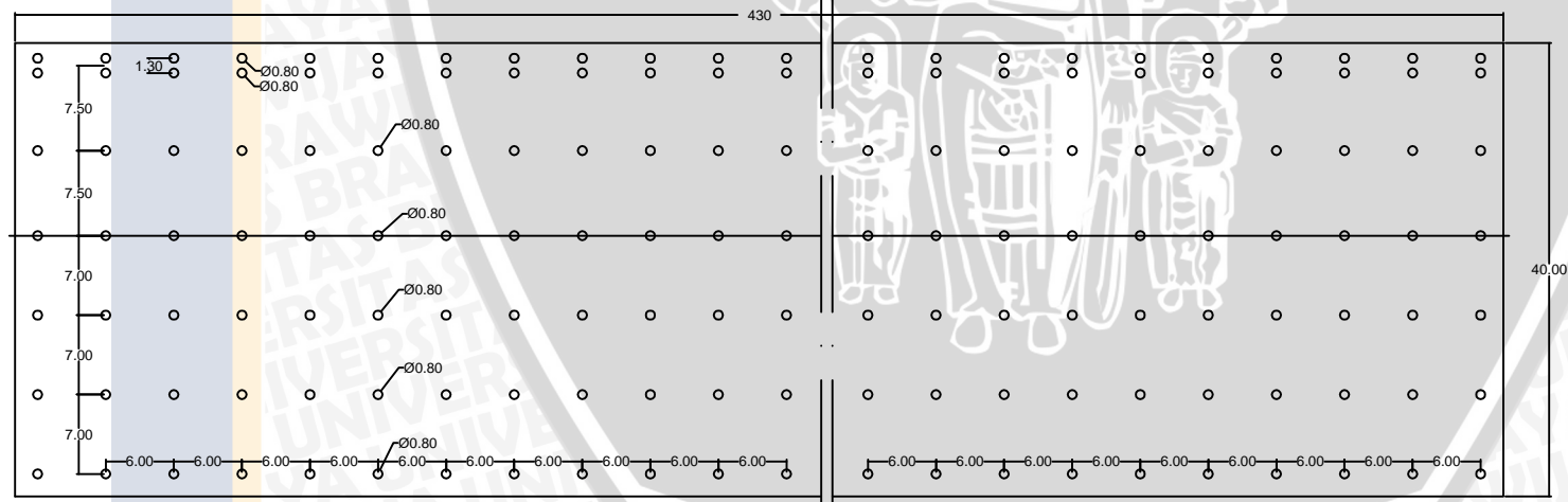
DENAH TIANG PANCANG SKALA 1 : 21

JUDUL SKRIPSI: PERENCANAAN DETAIL STRUKTUR DERMAGA BARU (PT. PETROKIMIA GRESIK) PERSERO