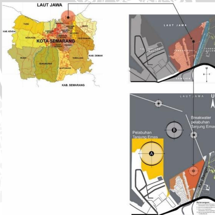
Gambar 3.1 Lokasi perancangan

Untuk lebih jelasnya, lokasi studi dapat dilihat pada Gambar 3.1