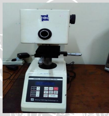
Gambar 3.4 Vickers Hardness Test