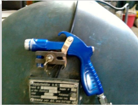
Gambar 3.1 Gun Blaster