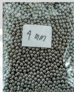
Gambar 3.5 Stainless steel ball