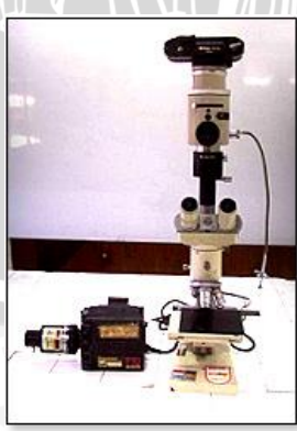
Gambar 3.5 Mikroskop Logam