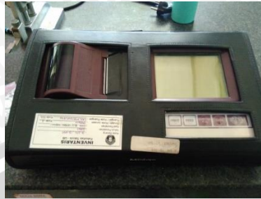
Gambar 3.3 Surface Roughness Test