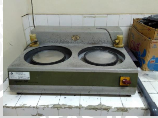
Gambar 3.3 Centrifugal Sand Paper Machine