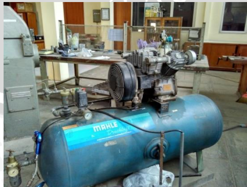
Gambar 3.2 Kompresor