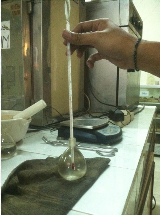
Kalibrasi Labu Ukur