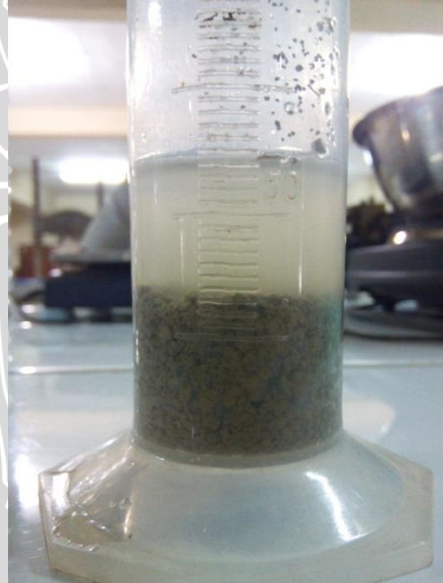
Pengujian Free Swell