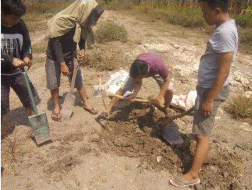
Proses Pengambilan Sampel Tanah Lempung Ekspansif di Kec.Ngasek Bojonegoro