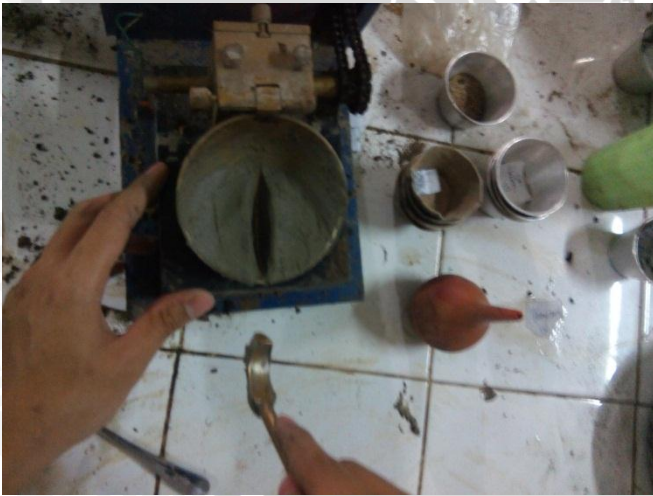
Pemeriksaan Batas-batas Atterberg