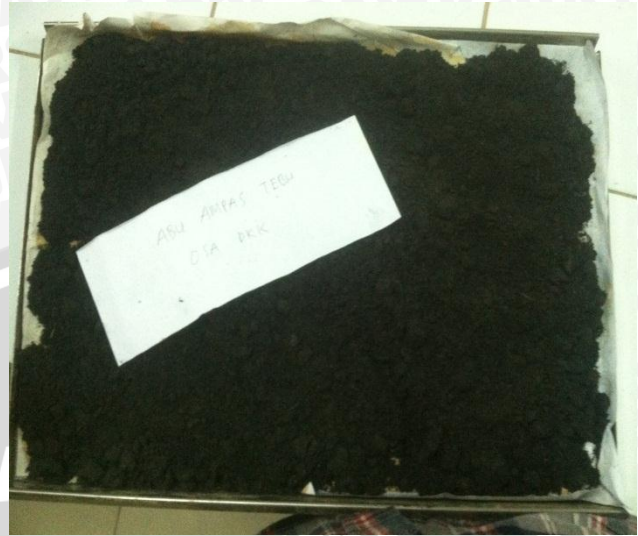
Abu Ampas Tebu