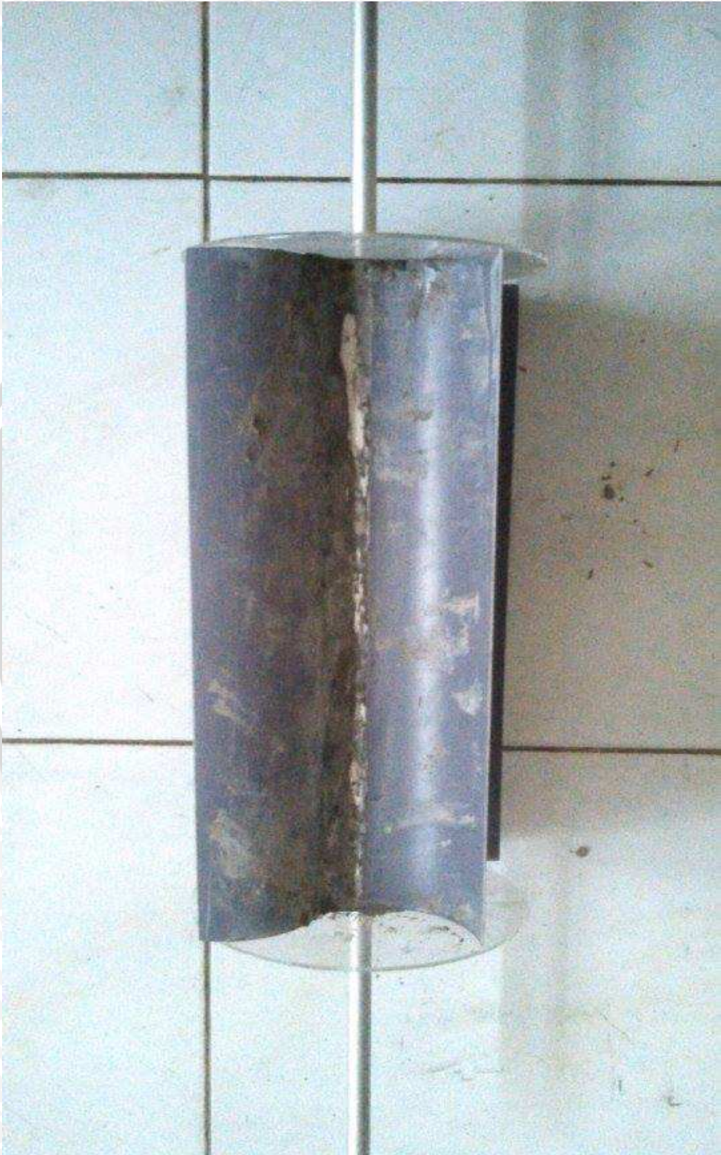
Keterangan : Kincir air dengan tinggi sudu 0,06 m