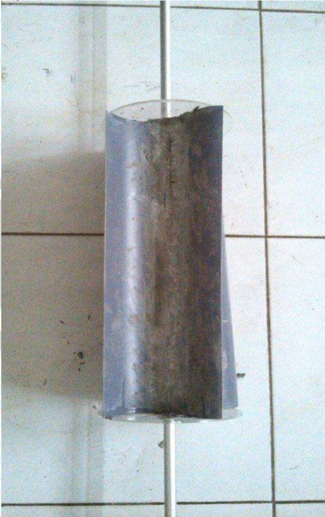
Keterangan : Kincir air dengan tinggi sudu 0,05 m