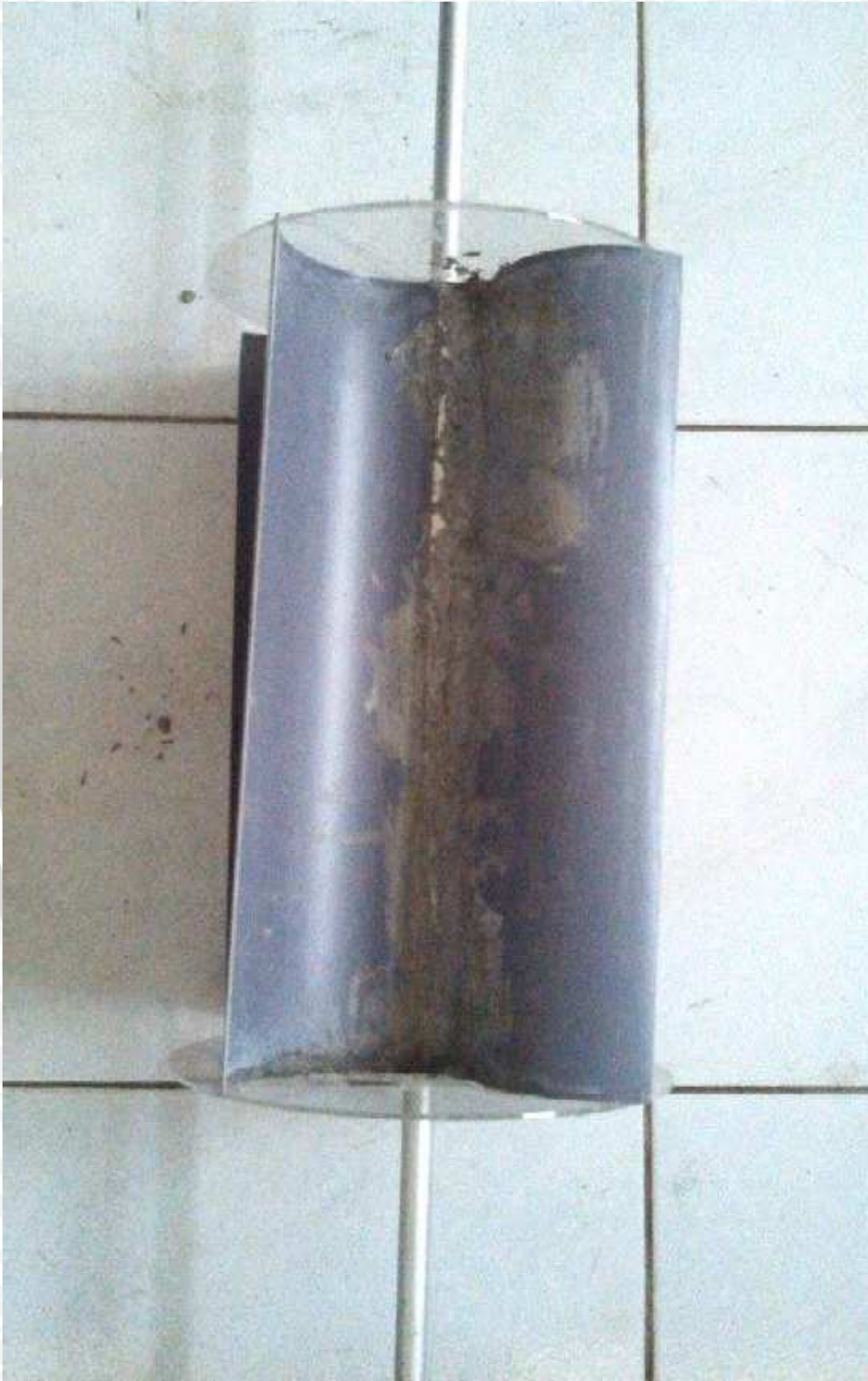
Keterangan : Kincir air dengan tinggi sudu 0,07 m