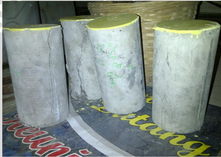
Beton silinder setelah di uji tekan