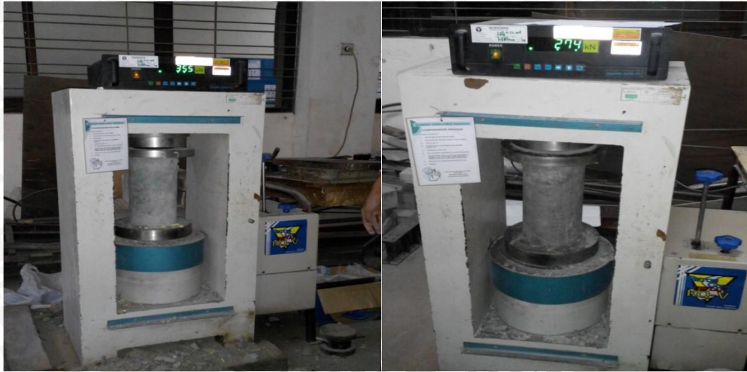
Pengujian kuat tekan