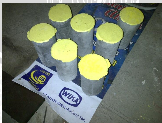
Beton silinder dicapung dengan belerang sebelum di uji tekan