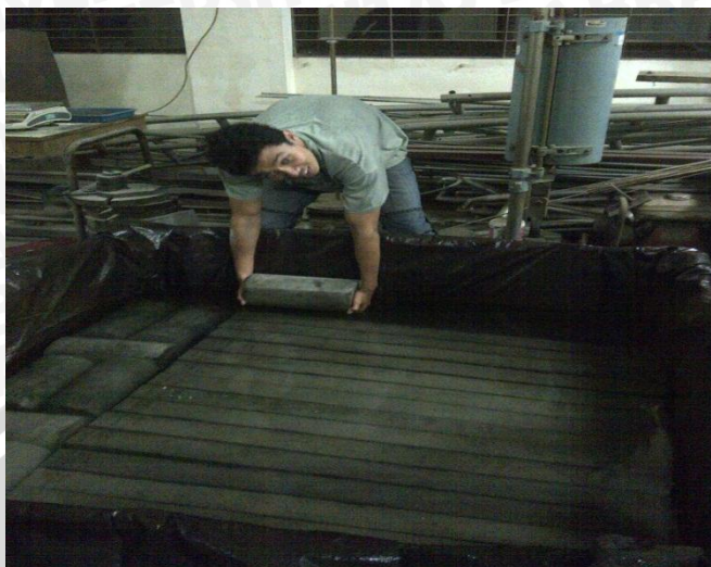
Proses perendaman beton silinder dengan air laut