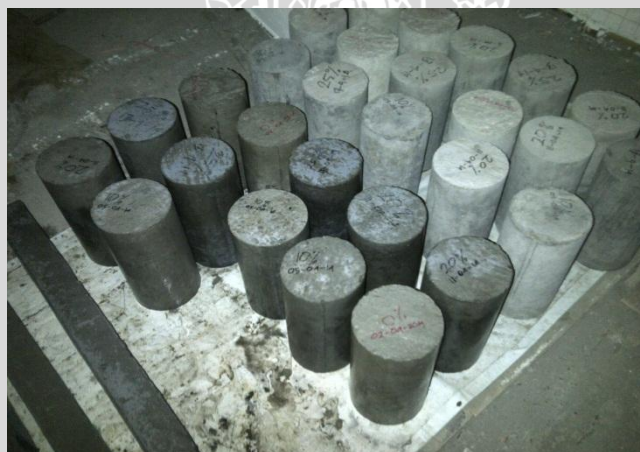
Beton silinder setelah perendaman