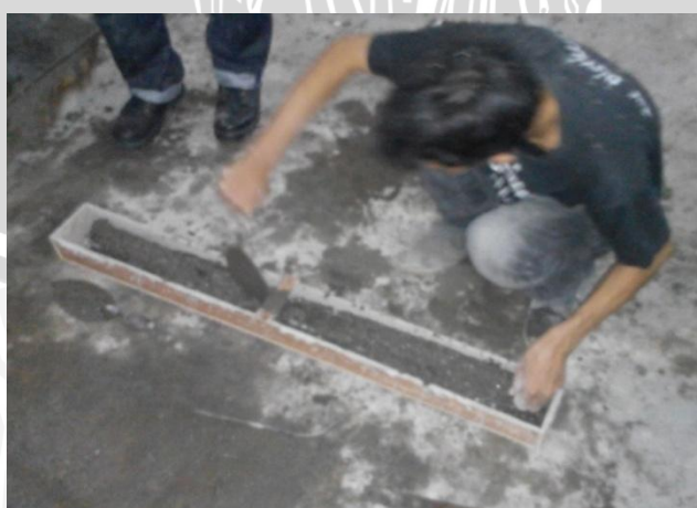
Pencetakan beton ke dalam bekisting