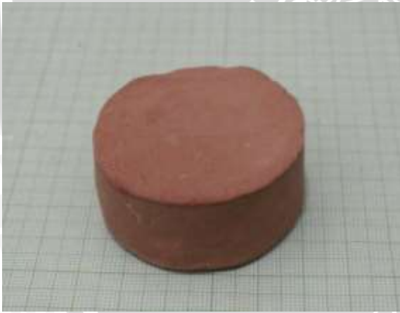
Spesimen 1: Fraksi massa kaolin dan feldspar (45+25)%