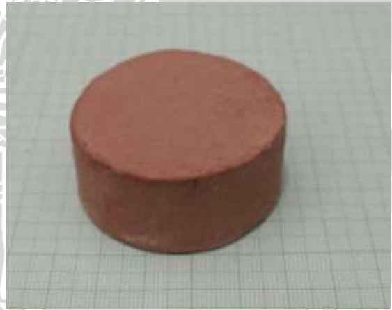
Spesimen 2: Fraksi massa kaolin dan feldspar (40+30)%