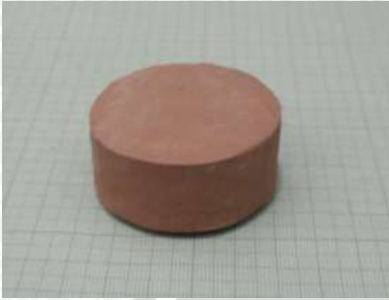
Spesimen 3: Fraksi massa kaolin dan feldspar (35+35)%