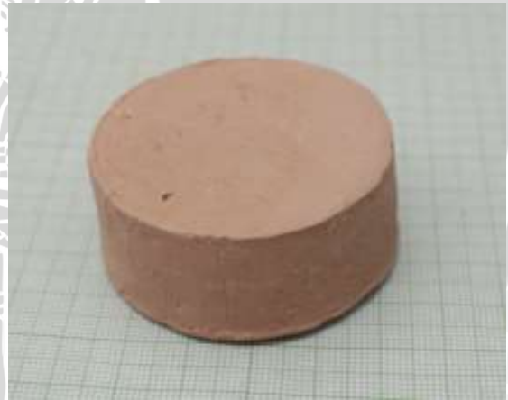
Spesimen 4: Fraksi massa kaolin dan feldspar (30+40)%