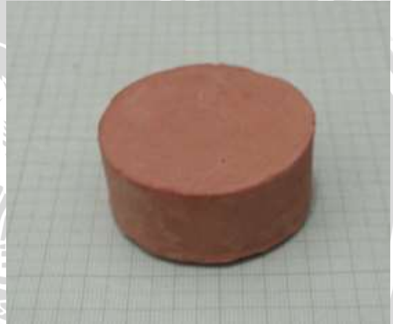
Spesimen 6: Fraksi massa kaolin dan feldspar (20+50)%