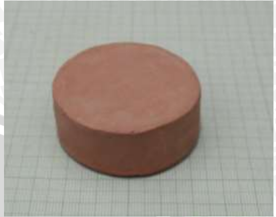
Spesimen 4: Fraksi massa kaolin dan feldspar (30+40)%