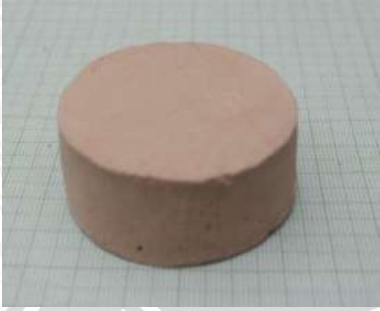
Spesimen 1: Fraksi massa kaolin dan feldspar (45+25)%