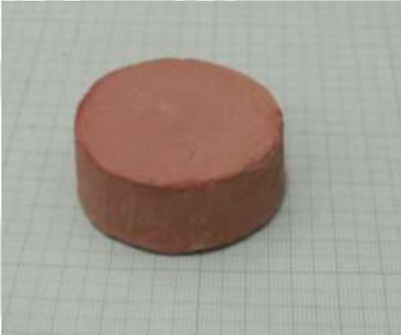
Spesimen 5: Fraksi massa kaolin dan feldspar (25+45)%