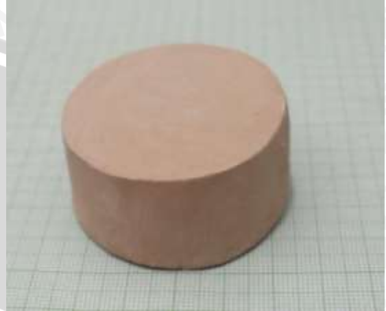
Spesimen 2: Fraksi massa kaolin dan feldspar (40+30)%