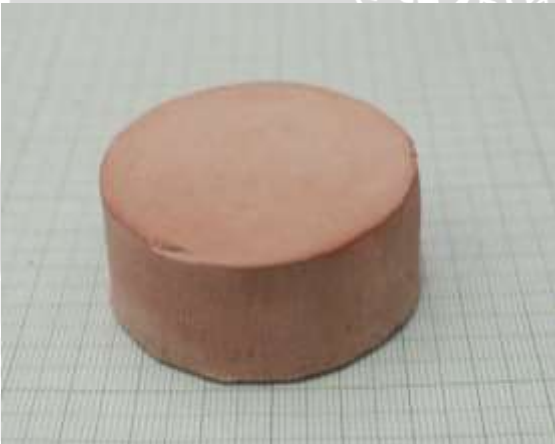
Spesimen 3: Fraksi massa kaolin dan feldspar (35+35)%