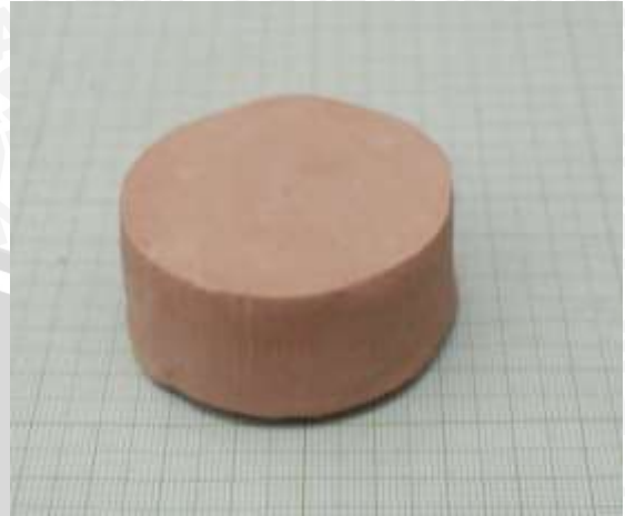
Spesimen 6: Fraksi massa kaolin dan feldspar (20+50)%