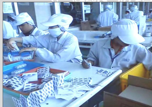
Operator A (kanan) : Pembagian strip 24 Operator C (kiri) : Pemasukan strip ke fb