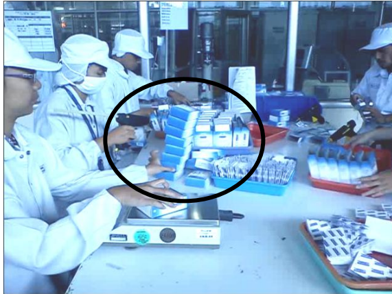
Folding box akan terjatuh