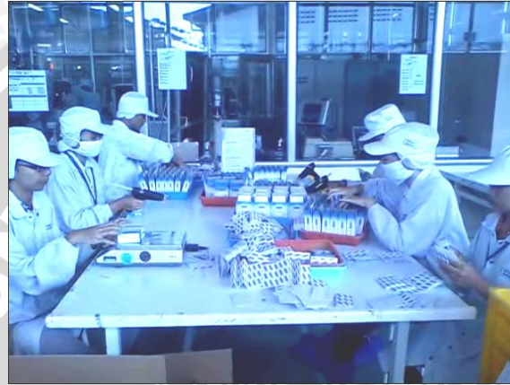
Layout kerja aktual