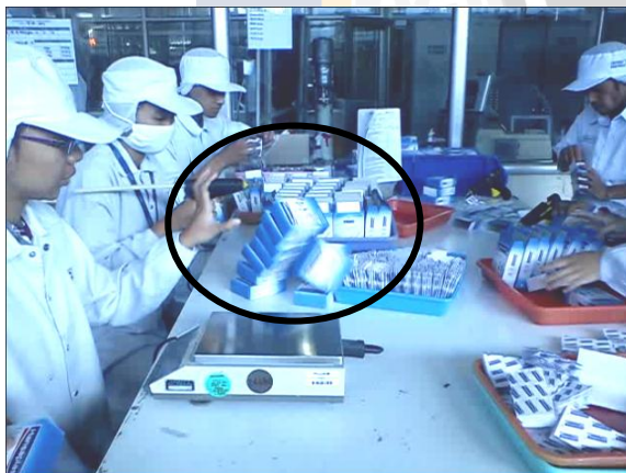
Folding box saat terjatuh