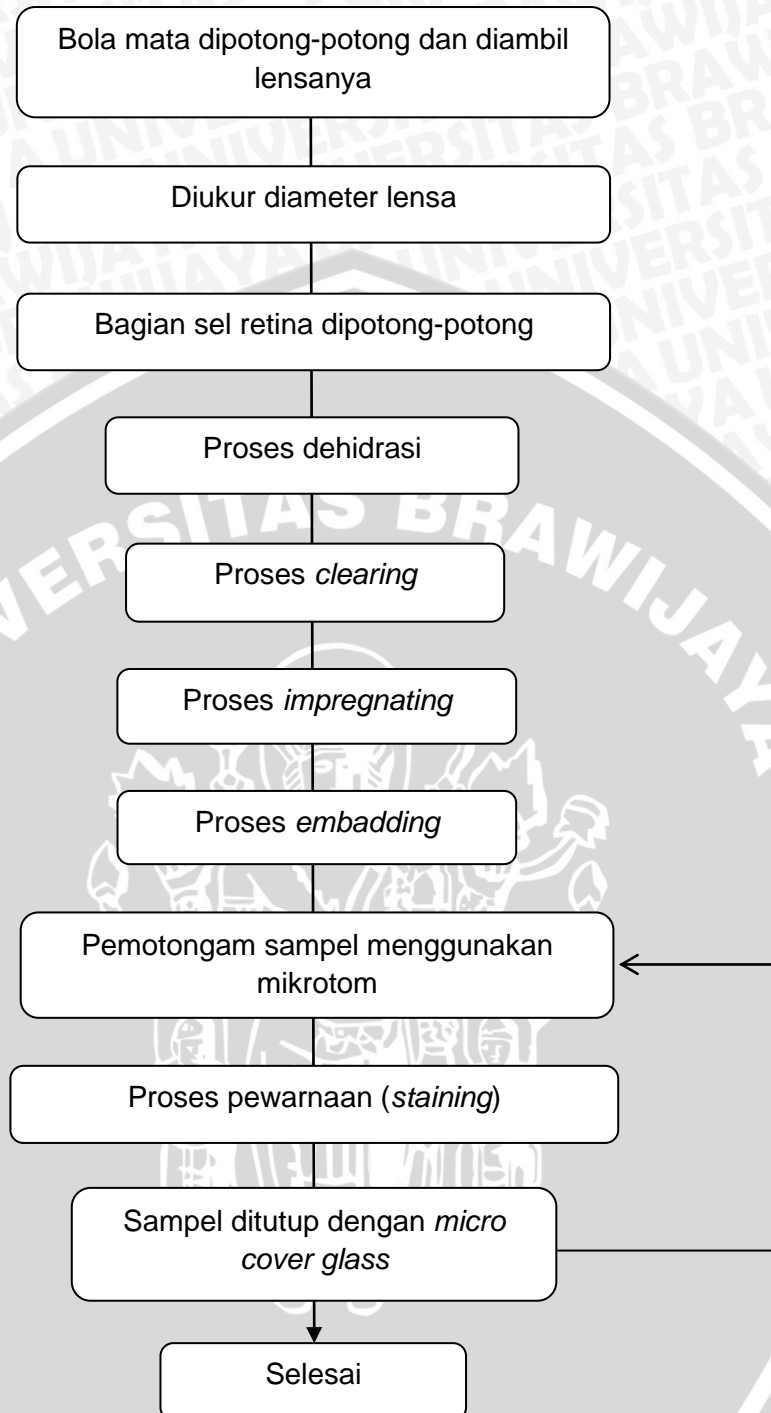
Gambar 6. Proses pembuatan preparat

Setelah proses clearing selesai, dilanjutkan pada proses impregnating , yaitu memasukkan sampel kedalam xylene + paraffin , dan paraffin . Yang bertujuan untuk memasukkan paraffin cair kedalam jaringan. Kemudian dimulai proses embedding . Embedding merupakan proses penanaman spesimen kedalam blok - blok paraffin yang kemudian sampel dicairkan salam oven