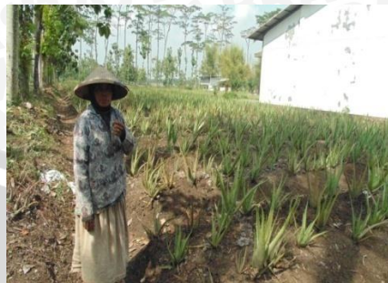
Petani mitra dalam perusahaan/