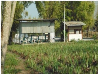
Lokasi lahan perusahaan