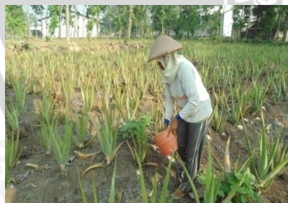
Pemupukan lahan budidaya petani