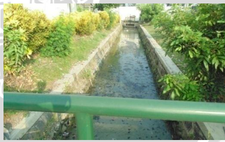
Sungai pembungan limbah