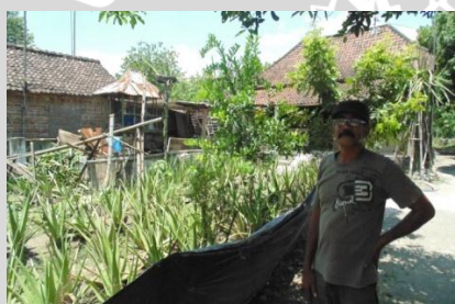
Petani mitra luar perusahaan