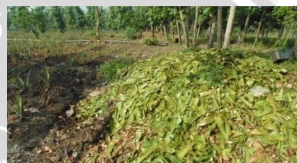
Pembuangan kulit buah