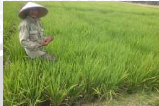
Lahan Sawah Pengguna Benih Bersertifikat