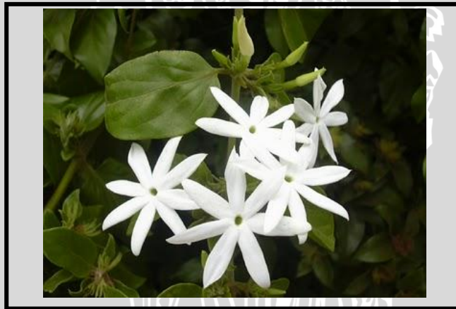
Gambar 1. Bunga melati Star Jasmine (Anonymous, 2013)

Star Jasmine merupakan salah satu tanaman hias yang termasuk dalam family Oleaceae. Plasma nutfah melati berasal dari daerah tropis di Asia. Diantara 200 jenis melati yang telah diidentifikasi oleh para ahli botani baru sekitar 9 jenis melati yang umum dibudidayakan dan terdapat 8 jenis melati yang berpotensi untuk dijadikan tanaman hias (Wahyurini dan Setyaningrum, 2004). Beberapa jenis melati yang umum ditanam di Indonesia dan dijadikan sebagai tanaman hias antara lain Star Jasmine ( Jasminum multiflorum ), melati putih ( Jasminum sambac ), melati Casablanca ( Jasminum officinale ) dan spesies lainnya seperti J. parkeri dan J. revolutum .