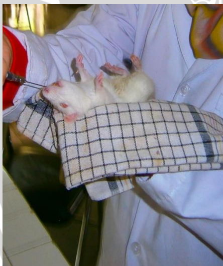
Sonde Ekstrak ECS