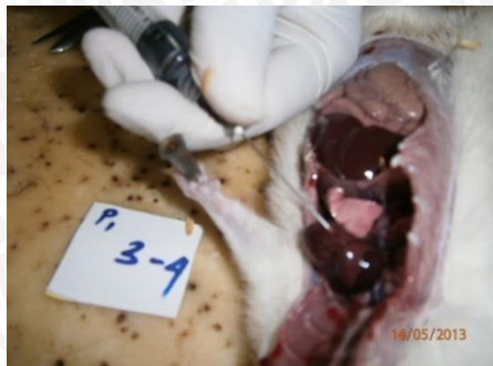
Mengambil Darah dari Jantung