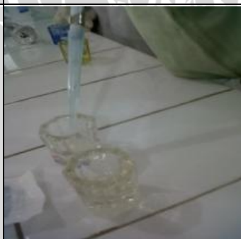
4 Juni 2013 Pemberian ekstrak daun kersen