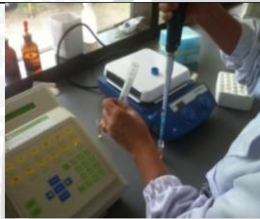
15 Maret 2013 Persiapan bakteri S.mutans