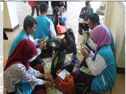
5 April 2013 Diskusi persiapan monev 1 fakultas