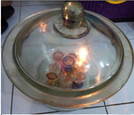
4 Juni 2013 Tabung Anaerob untuk inkubasi, terdapat api untuk memastikan tidak ada lagi Oksigen saat api mati