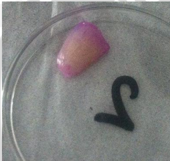
6 Juni 2013 Adanya area berwarna pada email gigi (terdapat plak)