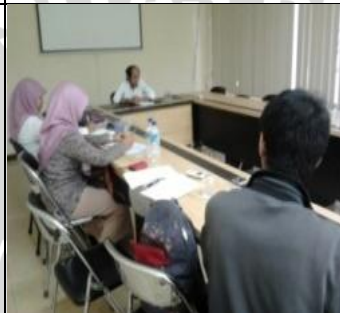
25 Maret 2013 Konsultasi drg.Chair (dosen pembimbing)