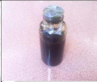
8 Maret 2013 Ekstrak daun kersen yang telah jadi