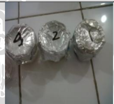
4 Juni 2013 Persiapan inkubasi, deppen glass ditutup aluminium foil