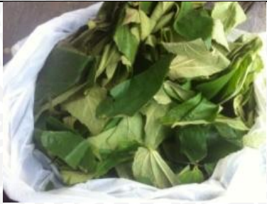
6 Maret 2013 Pemetikan daun kersen