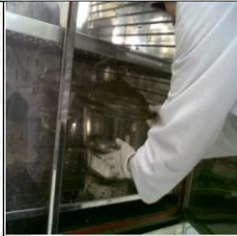
4 Juni 2013 Inkubasi anaerob selama 2x24 jam