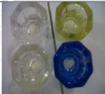
4 Juni 2013 Persiapan alat dan bahan sampel 1