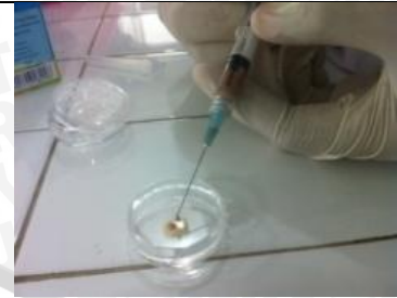
15 Maret 2013 Percobaan sampel 1 (aplikasi susu/ sukrosa)