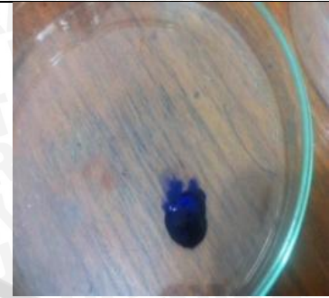
6 Juni 2013 Aplikasi disclosing agent