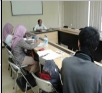
25 Maret 2013 Konsultasi drg.Chair (dosen pembimbing)