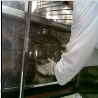
4 Juni 2013 Inkubasi anaerob selama 2x24 jam