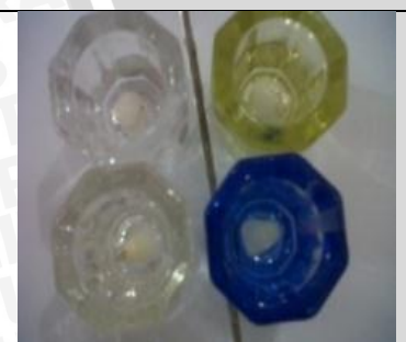
4 Juni 2013 Persiapan alat dan bahan sampel 1