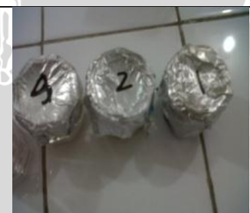
4 Juni 2013 Persiapan inkubasi, deppen glass ditutup aluminium foil