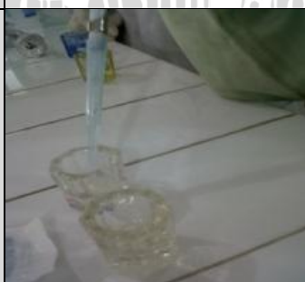
4 Juni 2013 Pemberian ekstrak daun kersen