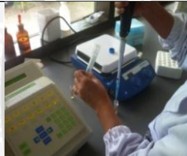
15 Maret 2013 Persiapan bakteri S.mutans