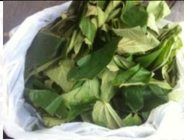
6 Maret 2013 Pemetikan daun kersen