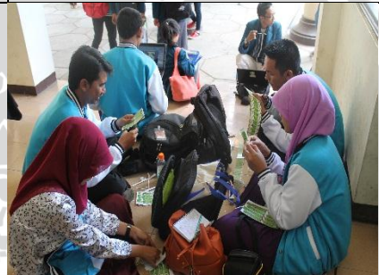
5 April 2013 Diskusi persiapan monev 1 fakultas