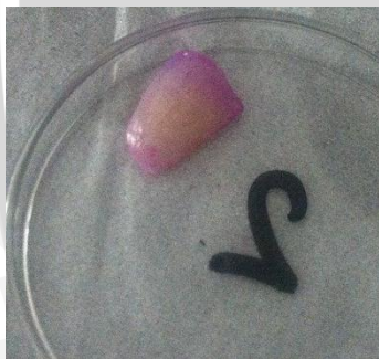
6 Juni 2013 Adanya area berwarna pada email gigi (terdapat plak)