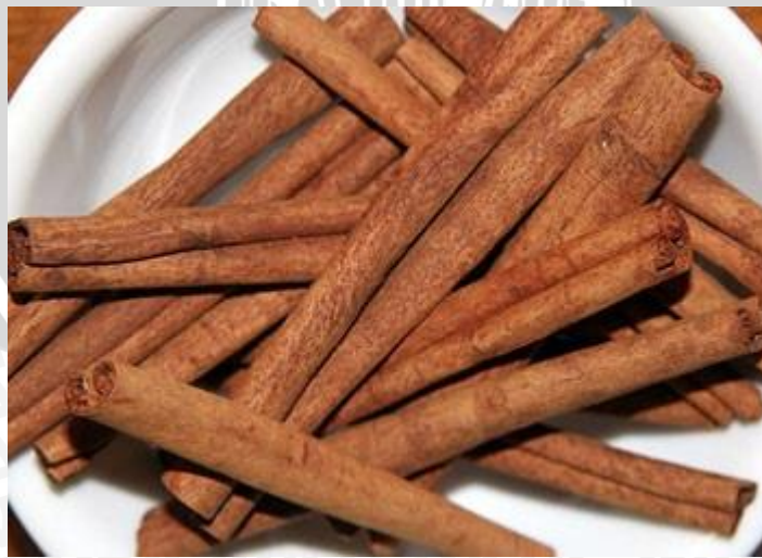
Gambar 2.2 Cinnamomum burmannii