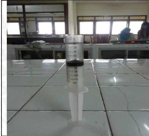
Gambar 6.7 Syringe Sebagai Gelas Ukur