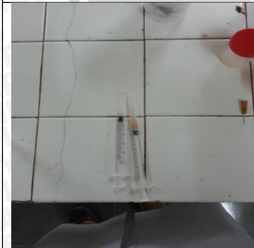
Gambar 6.5 Syringe untuk menyuntikan carrageen