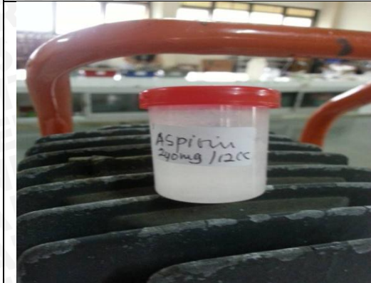
Gambar 6.3 Aspirin 200mg/kgBB