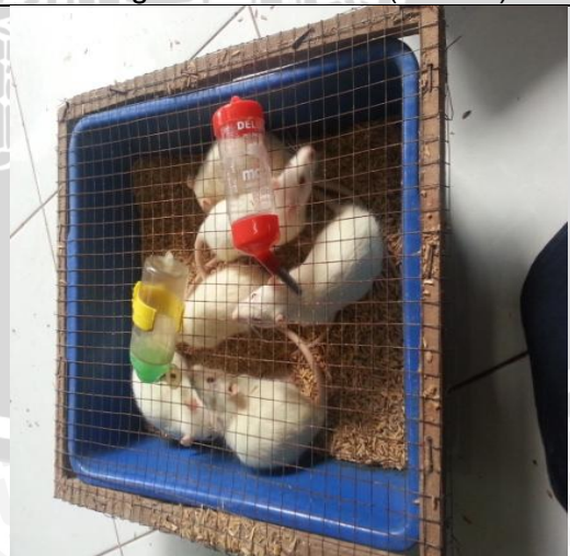
Gambar 6.6 Tikus dan Kandang