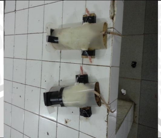
Gambar 6.8 Rat Fixator