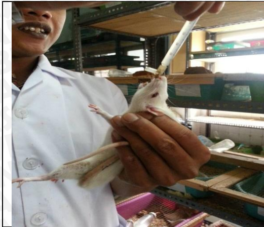
Gambar 6.1 Cara Menyonde Tikus Hewan Coba