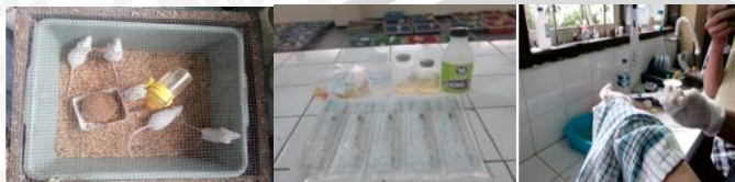
2) Pembuatan Ekstrak Kulit Kacang Tanah ( Arachis hypogea L ) dan Pemberian Ekstrak pada kelompok perlakuan