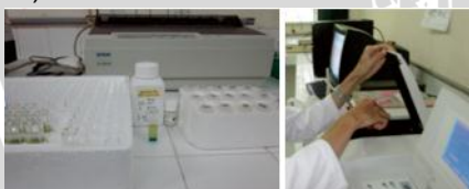
5) Pewarnaan Masson's Trichrome