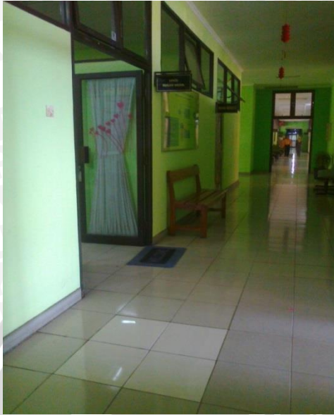
Gambar 12.1 Ruang Rekam Medis RSUD Dr. Saiful Anwar Malang