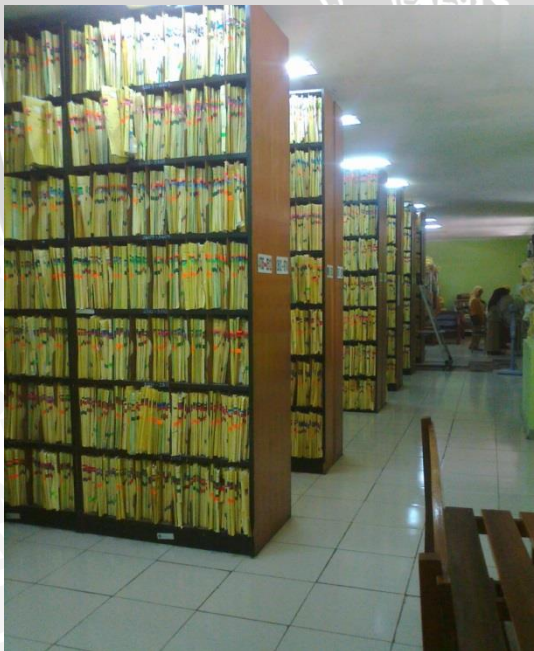
Gambar 12.2 Ruang Penyimpanan Berkas Rekam Medis Pasien RSUD Dr.Saiful Anwar Malang