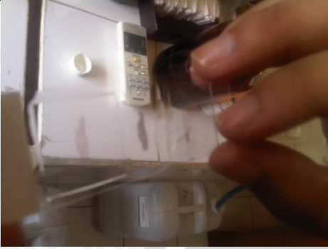
Gambar 1. Jaringan yang sedang dideparfinisasi