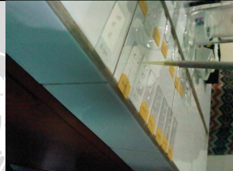
Gambar 4. Pemberian Xylool