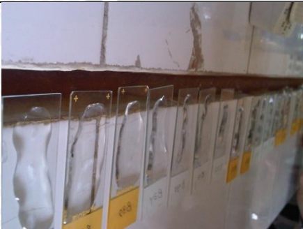
Gambar 7. Pemberian PBS untuk 'Pembilasan'