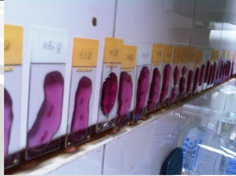
Gambar 2. Pengecatan Jaringan