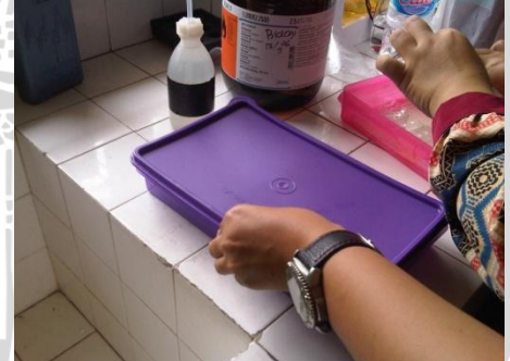
Gambar 6. Disimpan semalaman pd suhu 4° celcius