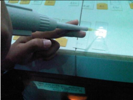
Gambar 3. Pemberian antibody