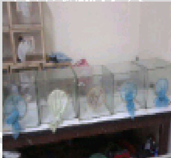
Gambar 4 : Kandang- kandang kaca yang digunakan