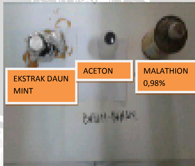
Gambar 2 : Bahan-bahan yang digunakan