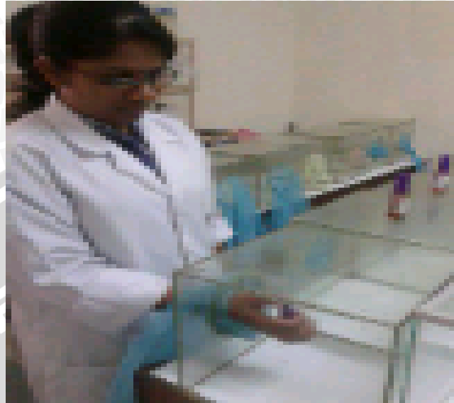
Gambar 5 : Proses penyemprotan ekstrak daun mint ke dalam kandang kaca sedang dilakukan