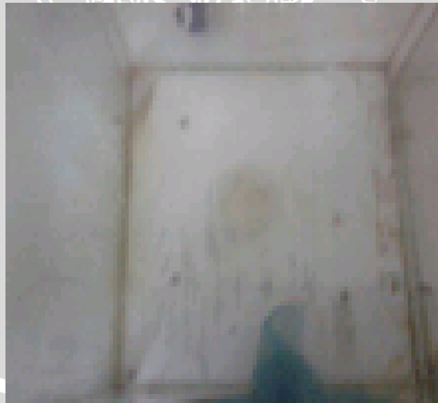
Gambar 6 : Kandang kaca yang mengandung lalat mati pada akhir penelitian