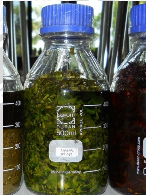
Gambar 1 : Proses pembuatan ekstrak daun mint