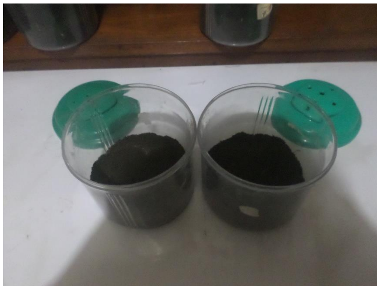
Gambar 12. Proses Pemindahan Tanah Ke Dalam Toples