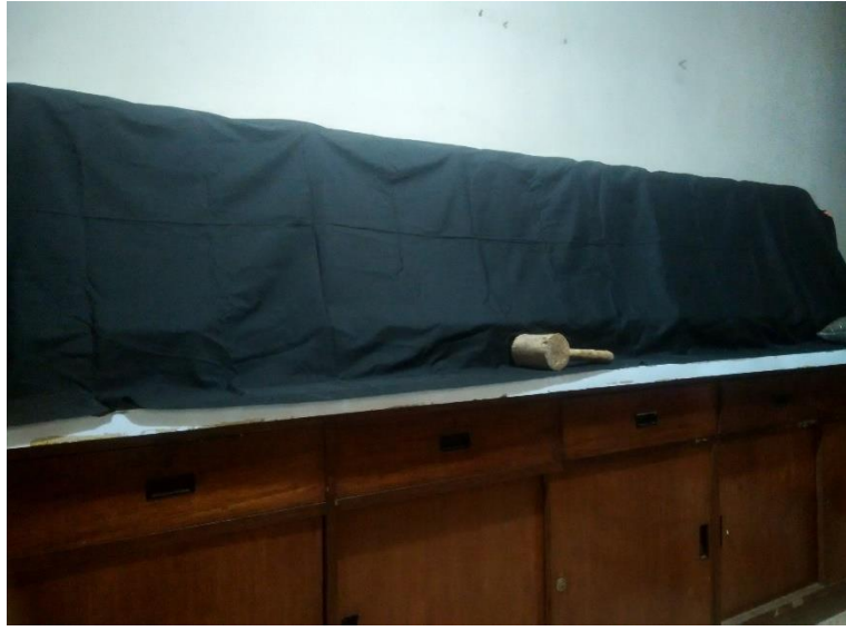
Gambar 18. Rak Penyimpanan Toples Yang Telah Ditutupi Dengan Kain Hitam