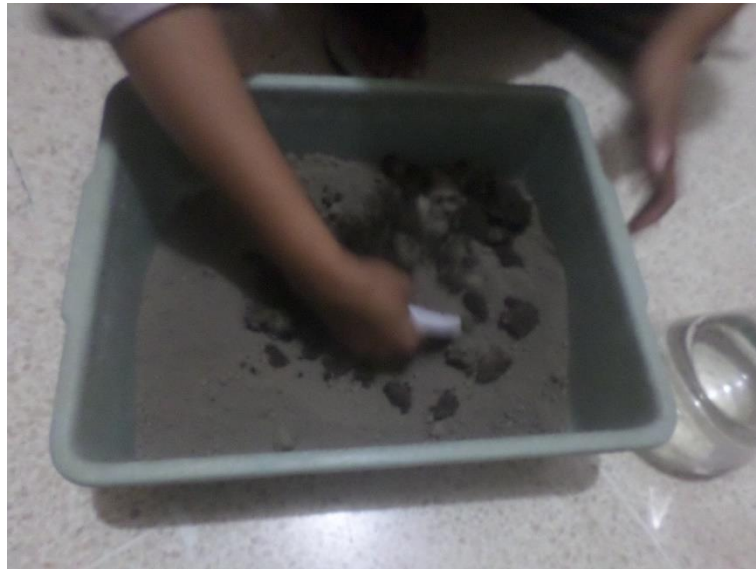
Gambar 10. Proses Pembasahan Tanah Untuk Meningkatkan Kelembaban Tanah