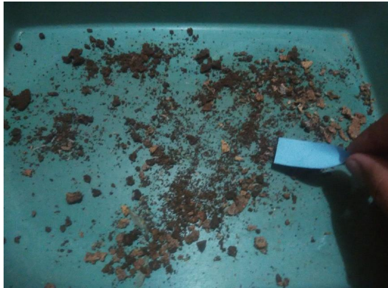
Gambar 15. Proses Pemindahan Rayap Ke Dalam Toples