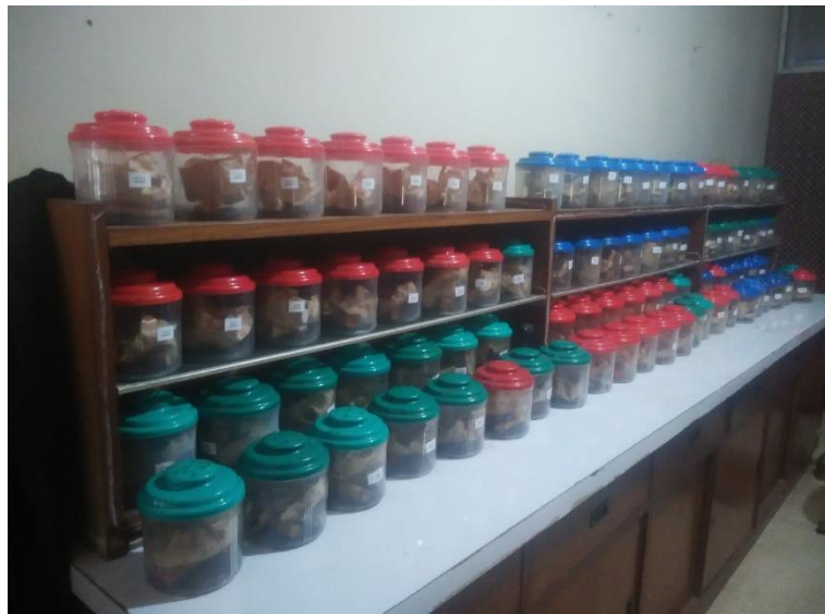
Gambar 17. Rak Penyimpanan Toples