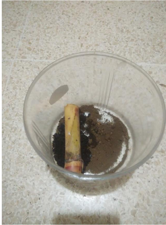
Gambar 14. Proses Peletakkan Tebu Sebagai Makanan Rayap Di Dalam Toples