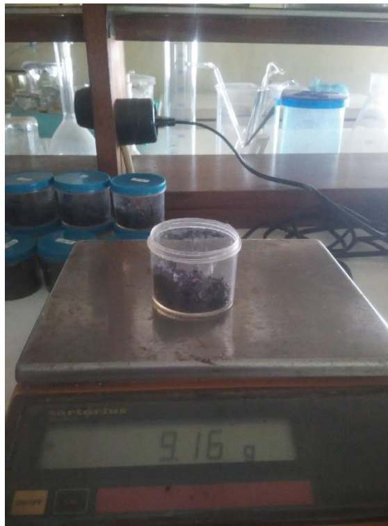
Gambar 11. Proses Penimbangan Limbah Kulit Mete