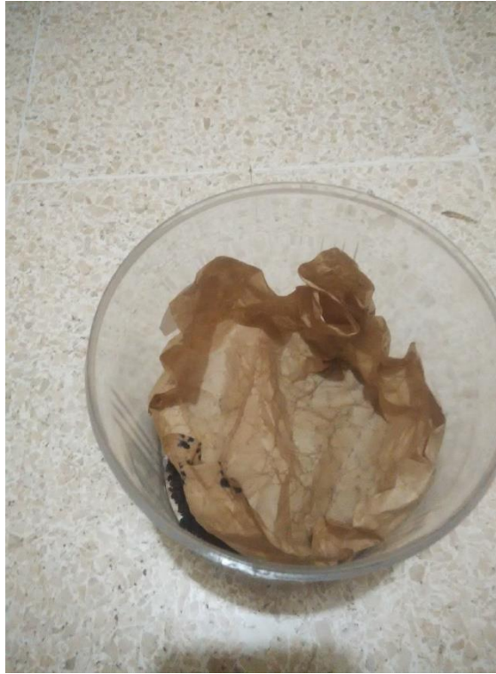
Gambar 16. Penutupan Dengan Kertas Semen Yang Sudah Dibasahi