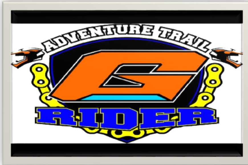
Gambar 1 Logo G Rider Adventure Trail