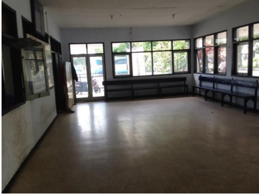
Fasilitas ruang tunggu penumpang