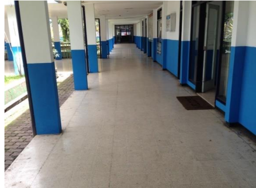
Lorong penghubung dari pintu masuk menuju ruang tunggu