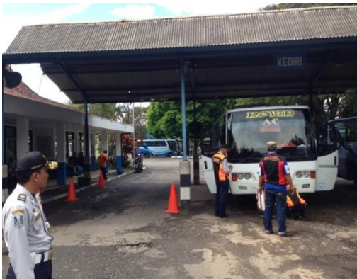
Jalur keberangkatan (naik) penumpang