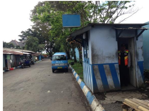
Jalur kedatangan (menurunkan) penumpang