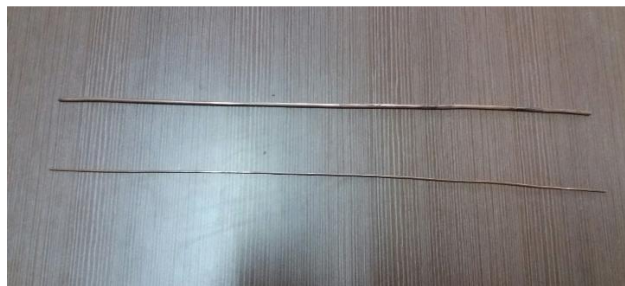
Gambar 2. Elektroda dalam