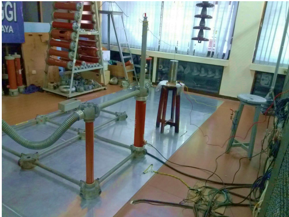
Gambar 7. Rangkaian pengukuran arus bocor pada susunan elektroda koaksial