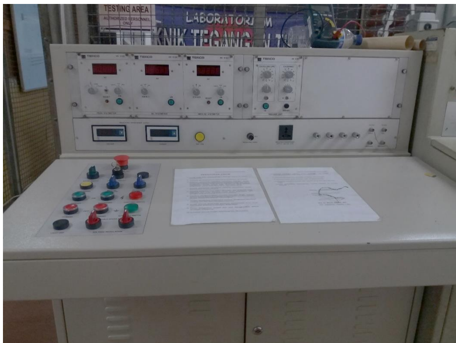
Gambar 5. Alat ukur tegangan tinggi AC dan DC pada control desk .