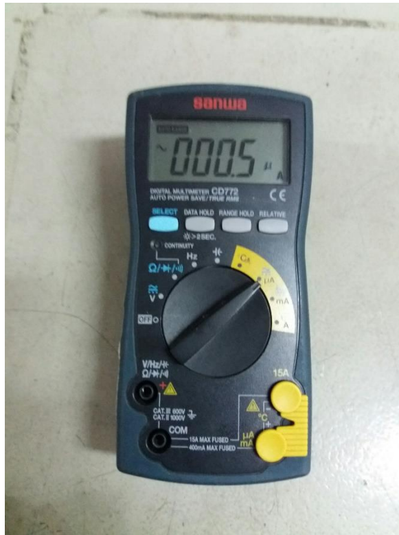
Gambar 6. Multimeter yang digunakan untuk mengukur arus bocor.