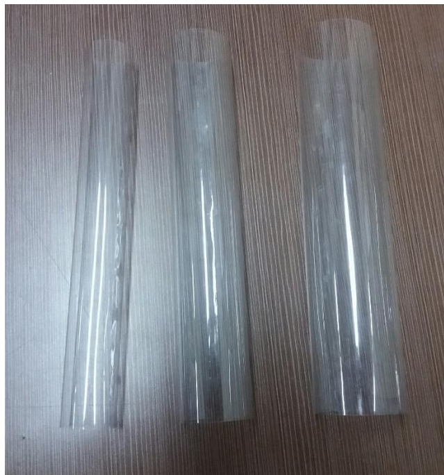
Gambar 3. Mika sebagai media sisipan