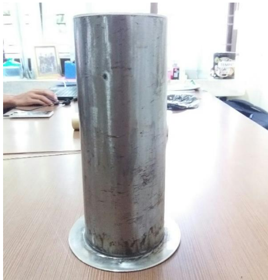
Gambar 1. Elektroda luar