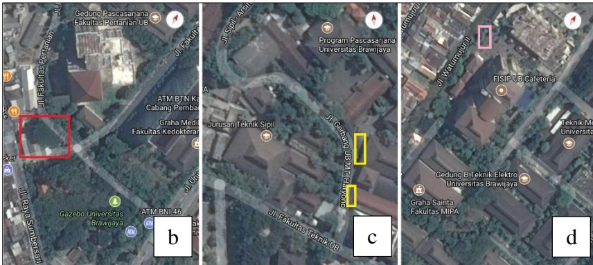
Gambar 4. Lokasi pengamatan tiga titik taman vertical garden kampus UB: a. Peta lokasi untuk pengamatan dan pengambilan sampel pada penelitian skripsi; b. Perbesaran 100ft Lokasi 1 di pertigaan antara Fakultas Kedokteran, Fakultas Pertanian, dan gazebo kampus Universitas Brawijaya; c. Perbesaran 100ft Lokasi 2 di Laboratorium Hidrolika Terapan Fakultas Teknik Universitas Brawijaya; d. Perbesaran 100ft Lokasi 3 di Fakultas Ilmu Sosial dan Ilmu Politik Universitas Brawijaya.