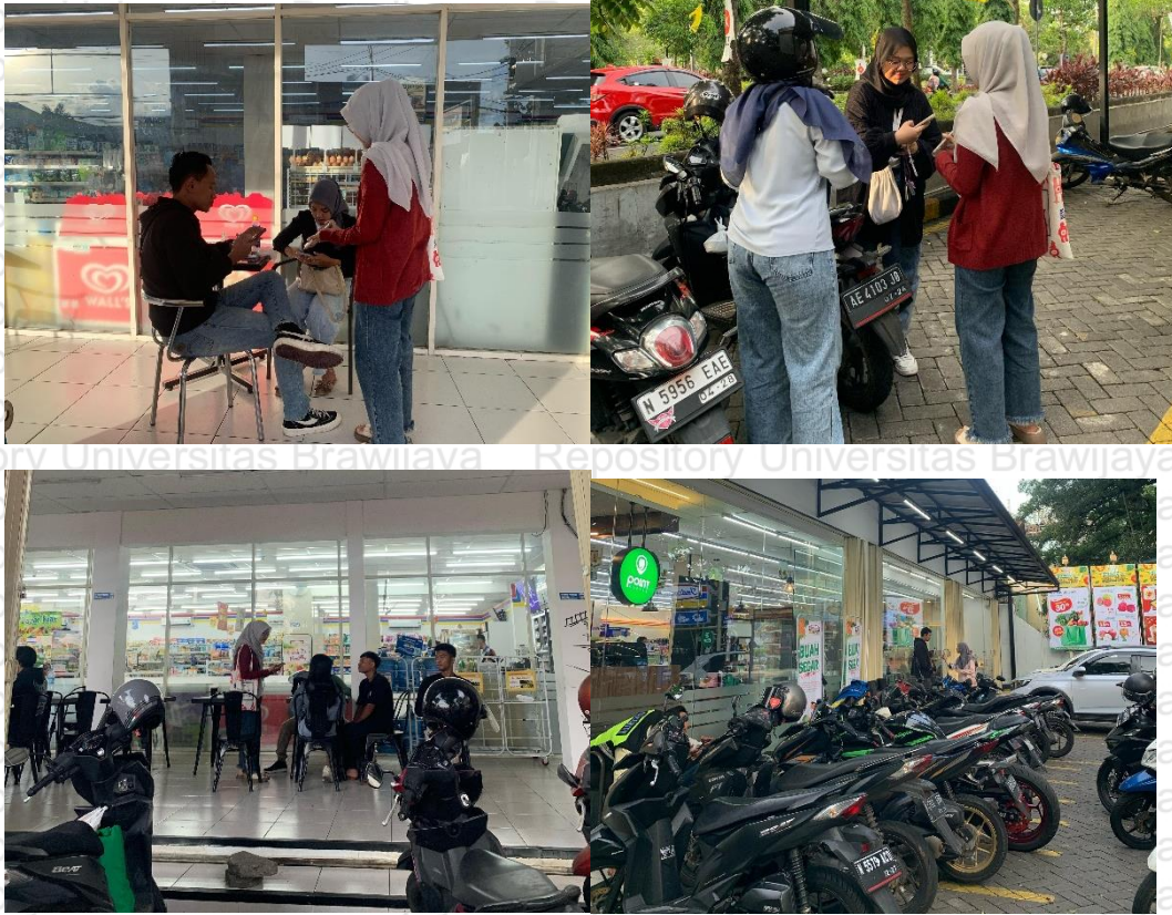
Lampiran 113. Dokumentasi Produk YC