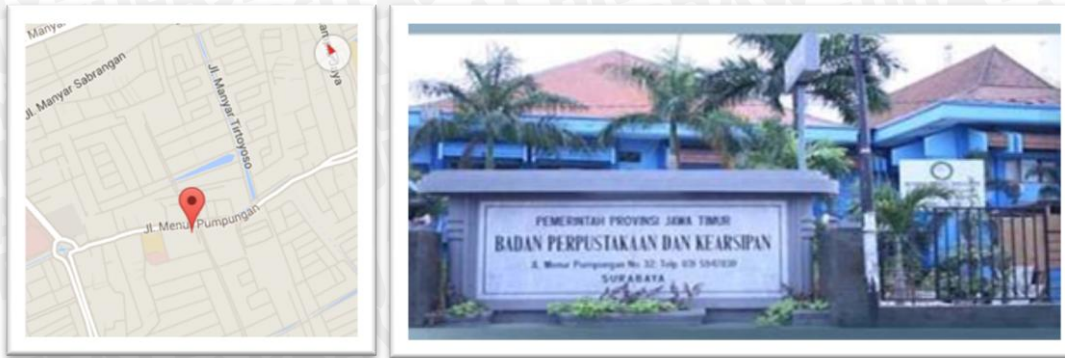
Gambar 3.1 Studi Kasus “Badan Perpustakaan dan Kearsipan Propinsi Jawa Timur”