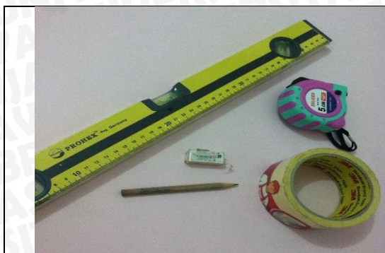
Waterpass dan Meteran