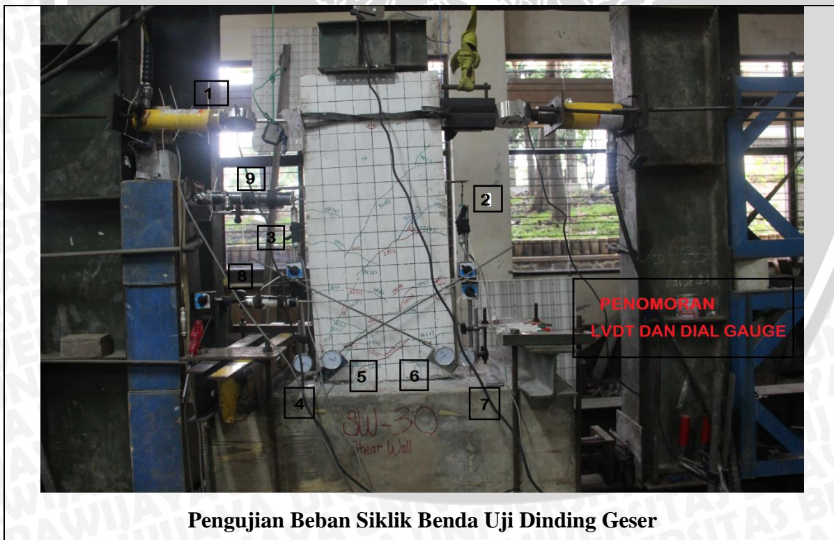
Pengujian Beban Siklik Benda Uji Dinding Geser