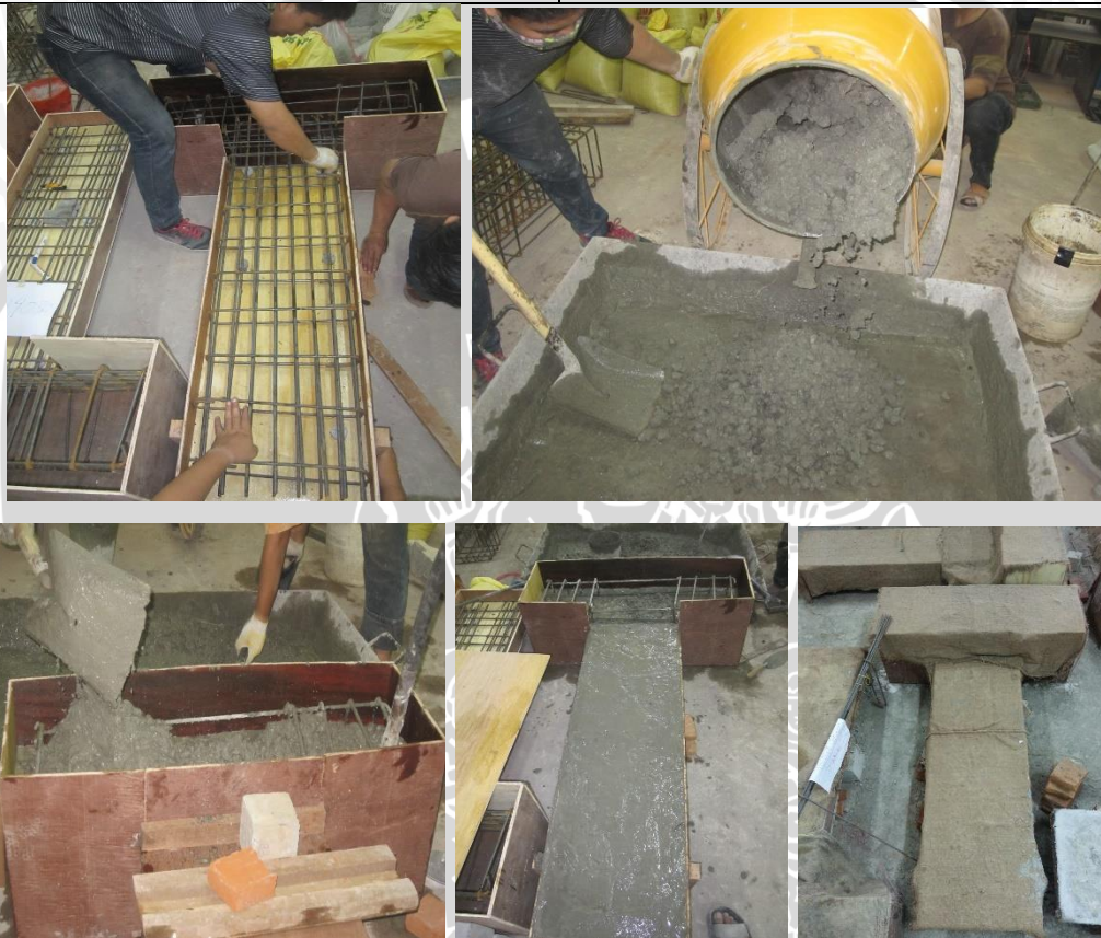
Pengecoran Spesimen Dinding Geser