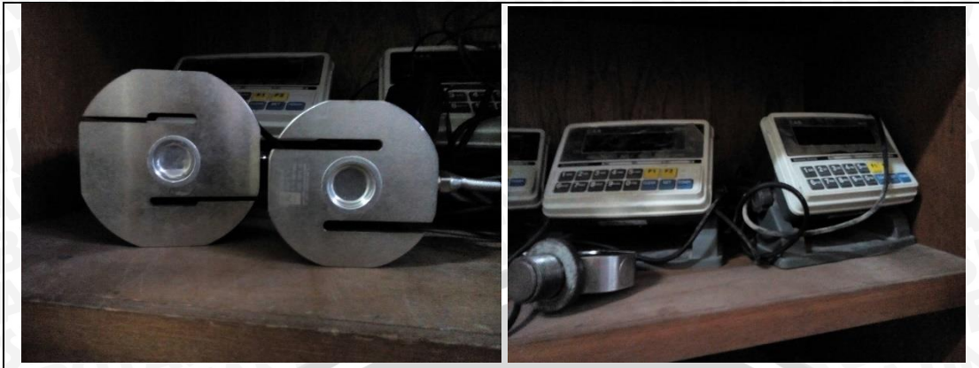
Load Cell dan Pembacanya