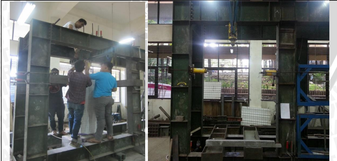
Setting Up Frame