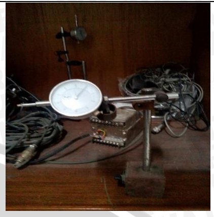
Analog Dial Gauge