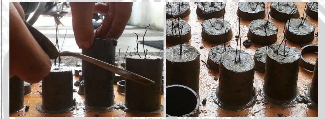
Pembuatan Tahu Beton