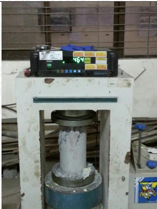
Uji Tekan Silinder Beton