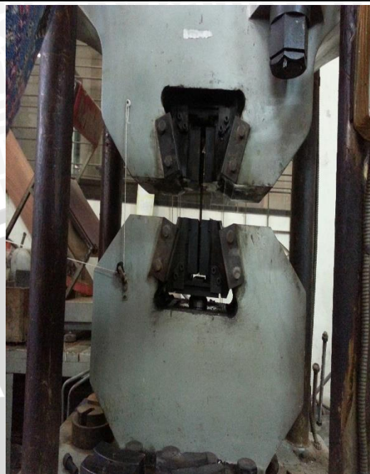
Uji Tarik Baja