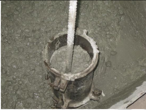
Pembuatan Silinder Beton