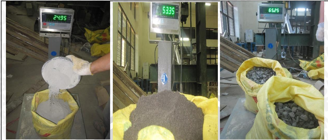
Penimbangan Bahan Penyusun Dinding Geser