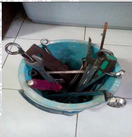
Kunci inggris, mur, obeng, pemotong besi dan baut