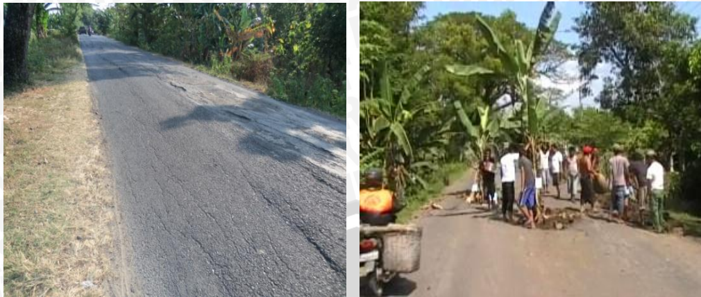
Gambar 1.2 Kondisi Jalan di Paron Kabupaten Ngawi

Tanah ekspansif merupakan tanah yang memiliki potensi mengembang dan menyusut secara ekstrim. Sifat kembang-susut ini merupakan faktor penyebab yang dominan terhadap kejadian kerusakan perkerasan jalan karena dapat mendorong perkerasan jalan ke arah vertikal dan dapat menarik secara lateral. Masalah kembang-susut ini terjadi pada tanah lempungan dengan perubahan kadar air yang tinggi, sehingga fleksibilitas perkerasan tidak mampu mengikuti perubahan sifat tanah ekspansif, maka kerusakanpun tak dapat dihindari. Tanah lempung ekspansif merupakan jenis tanah berbutir halus dengan ukuran koloidal terbentuk dari mineral ekspansif. Beberapa jenis mineral ekspansif diantaranya adalah montmorillonite, illite dan kaolinite. Semua tanah lempung yang mengandung mineral ekspansif akan mempunyai sifat mengembang dan menyusut yang besar, apabila terjadi penambahan atau pengurangan kadar airnya.