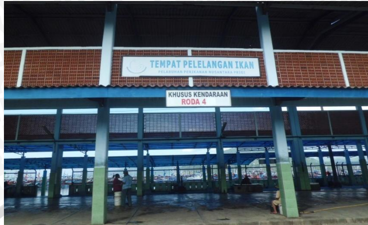
Gambar 3. Tempat Pelelangan Ikan (TPI)

Penanganan ikan merupakan proses awal yang sangat menentukan dalam proses pengolahan dan pemasaran. Mutu ikan yang didapatkan akan banyak ditentukan pada proses penanganan, namun kegiatan pengoperasian purse seine di Prigi tidak memerlukan suatu penanganan khusus terhadap hasil tangkapan, misalnya pemberian es untuk menjaga kesegaran ikan, karena operasi yang dilakukan adalah satu hari penangkapan ikan dan mutu hasil tangkapan yang diperoleh masih dalam keadaan baik.