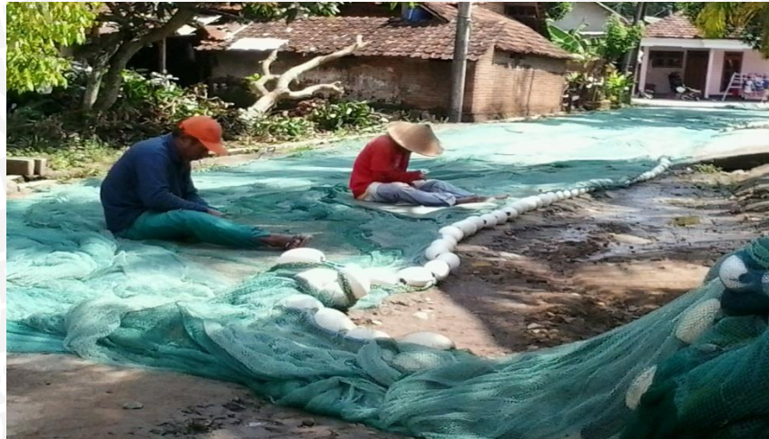
Gambar 8. Alat tangkap purse seine