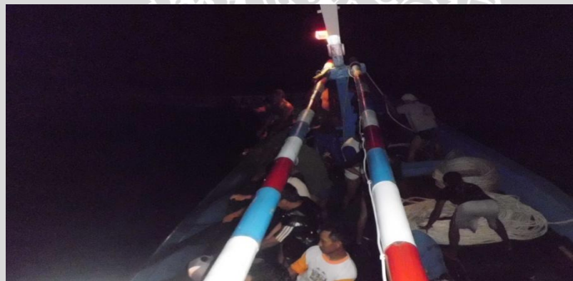
Gambar 10. Penarikan atau hauling purse seine

kapal johnson untuk dilakukan penarikan purse line dengan kekuatan penuh yang arahnya menjauhi kapal utama. Pada saat dilakukan penarikan purse line oleh kapal johnson, proses penarikan purse seine juga dilakukan oleh nelayan pada kapal utama (Gambar 10). Setelah proses penarikan purse line selesai, kapal johnson kembali dan mendekati purse seine yang sudah membentuk sebuah mangkok, kemudian dilakukan pengangkatan pelampung yang berada di kantong. Penarikan purse seine selesai hingga tersisa bagian kantong, maka dilakukan pengangkatan hasil tangkapan oleh nelayan yang berada pada kapal johnson untuk diletakkan pada kapal johnson. Proses penarikan purse line oleh kapal johnson membutuhkan waktu sekitar 8 menit, sedangkan penarikan ( hauling ) purse seine hingga selesai membutuhkan waktu sekitar 45 – 90 menit.