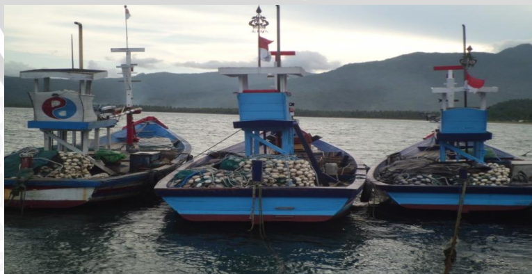
Gambar 6. Kapal utama

Kapal purse seine yang dioperasikan di Prigi untuk kegiatan penangkapan ikan menggunakan tipe dua buah kapal ( two boat system ) yaitu terdiri atas kapal utama yang berfungsi untuk melingkarkan jaring purse seine pada saat operasi penangkapan berlangsung, dan kapal johnson yang berfungsi untuk menarik purse line setelah pelingkaran purse seine selesai dan sebagai tempat hasil tangkapan. Kedua kapal tersebut terbuat dari bahan kayu. Kapal utama di Prigi (Gambar 6), memiliki ukuran berkisar 18,02 - 31,69 GT dengan panjang (L) antara 15 - 20 m, lebar (B) 4 - 5 m, dan dalam (D) 1,2 - 1,7 m, sedangkan untuk kapal johnson (Gambar 7) memiliki ukuran 10,25 - 14,91 GT dengan panjang antara 10 - 15 m, lebar 3,5 - 4 m dan dalam 1 - 1,2 m (Tabel 3).