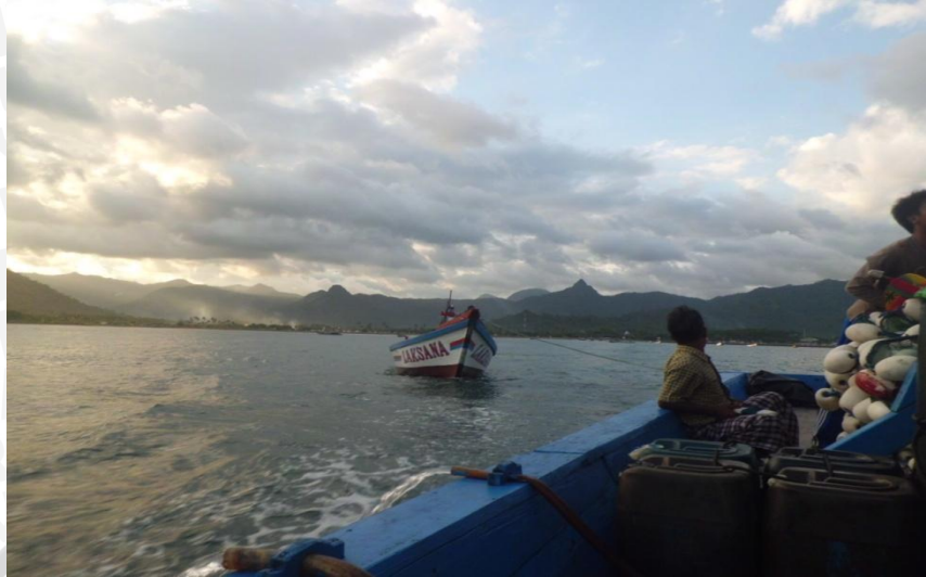
Gambar 9. Proses ditariknya kapal johnson ke kapal utama.