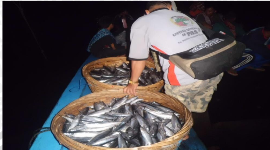
Gambar 4. Ikan tongkol kecil, salah satu hasil tangkapan purse seine di Prigi

Ikan-ikan yang sudah terjual pada pedagang pengumpul, dari pihak TPI dikenakan retribusi sebesar 2,5% begitu juga untuk pemilik kapal atau juragan kapal terkena retribusi sebesar 2,5%. Selain dijual dalam bentuk segar, ikan hasil tangkapan nelayan Prigi oleh pihak pengolah hasil perikanan diolah dalam bentuk pindang, kering (asin dan tawar) dan asap (panggang). Ikan-ikan hasil tangkapan oleh pihak nelayan ada yang sebagian dijual tidak melalui TPI, namun langsung ke pihak pedagang pengumpul (bakul) dan pengolah hasil perikanan.