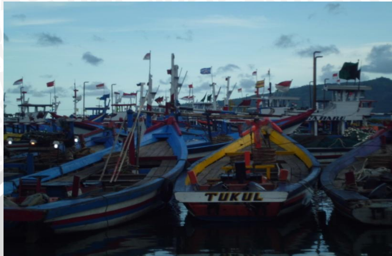
Gambar 7. Kapal Johnson

10 hari. Perawatan yang dilakukan meliputi pengecatan atau perbaikan jika ada kerusakan pada kapal.