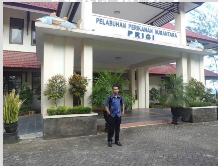
Gambar 2. Kantor Pelabuhan Perikanan Nusantara (PPN) Prigi

Pelabuhan Perikanan Nusantara Prigi dibangun diatas lahan seluas 27,5 hektar dengan luas tanah 11,5 hektar dan luas kolam labuh 16 hektar. Terletak pada posisi koordinat 111^{\circ} 43' 58'' BT dan 8^{\circ} 17' 22'' LS, yaitu tepatnya berada di Desa Tasikmadu, Kecamatan Watulimo, Kabupaten Trenggalek Provinsi Jawa Timur atau sebelah tenggara kota Trenggalek. Jarak ke ibukota provinsi (kota Surabaya) adalah \pm 200 km, sedangkan jarak ke Kabupaten Trenggalek adalah \pm 47 km.