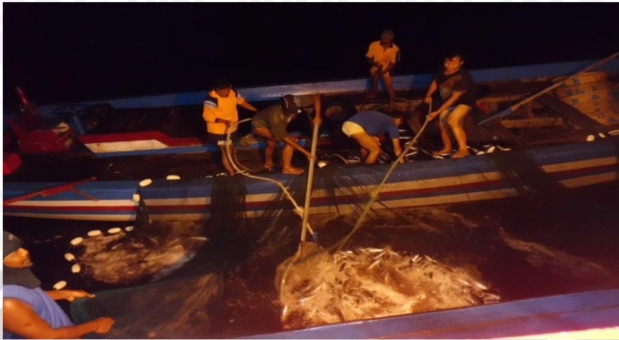
Gambar 11. Pengambilan ikan hasil tangkapan menggunakan serok

kegiatan penangkapan berikutnya, dilakukan perbaikan-perbaikan jaring jika terjadi kerusakan.