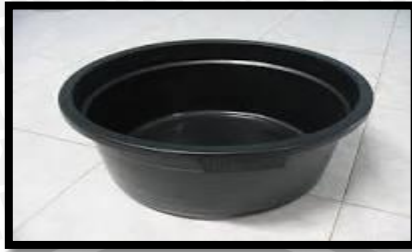
Gambar 6. Bak Besar