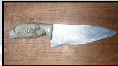
Gambar 7. Pisau

Fungsinya untuk membantu proses pemisahan bagian-bagian ikan (daging, tulang, sisik). Pisau dapat dilihat pada Gambar 7.