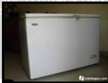
Gambar 3. Freseer