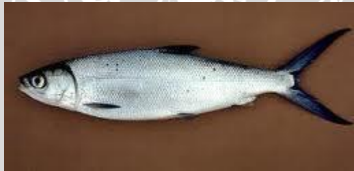
Gambar 1. Ikan Bandeng ( Chanos chanos )

Ikan Bandeng (Latin: Chanos chanos atau Inggris: Milkfish ) merupakan salah satu jenis ikan yang memiliki rasa yang spesifik, dan telah dikenal di Indonesia bahkan di luar negeri. Menurut penelitian Balai Pengembangan dan Penelitian Mutu Perikanan (1996), kandungan omega-3 Bandeng sebesar 14.2% melebihi kandungan omega-3 pada ikan salmon (2.6%), ikan tuna (0.2%) dan ikan sardines/ mackerel