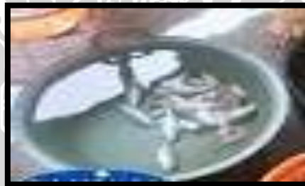
Gambar 5. Bak Pencuci

Bak ini digunakan untuk mencuci bahan baku (ikan bandeng) yang telah disiangi dan akan diproses lebih lanjut. Bak pencuci dapat dilihat pada Gambar 5.