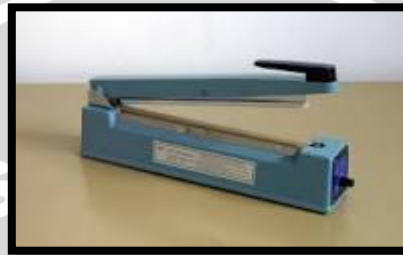
Gambar 4. Hand Film Sealer

Mesin pengemas yang dimaksud adalah hand film sealer yaitu mesin pengemas yang pengoperasiannya menggunakan tangan. Hand film sealer dapat dilihat pada Gambar 4.