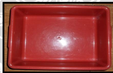
Gambar 10. Wadah Plastik Kecil

Berfungsi sebagai wadah pengumpul duri ikan yang telah dibuang durinya sehingga kualitas dan mutunya terjaga. Wadah plastic kecil dapat dilihat pada Gambar 10.