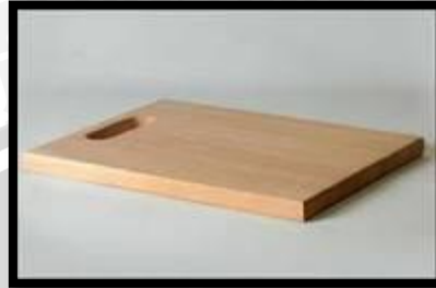
Gambar 9. Telenan

dibuang duri utamanya serta buang duri diseluruh tubuhnya. Telenan dapat dilihat pada Gambar 9.