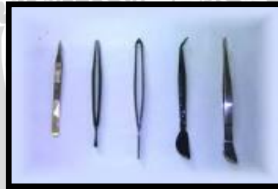
Gambar 8. Pinset

Pinset merupakan alat yang digunakan untuk mencabut duri sulit dijangkau di dalam ikan bandeng. Pinset dapat dilihat pada Gambar 8.