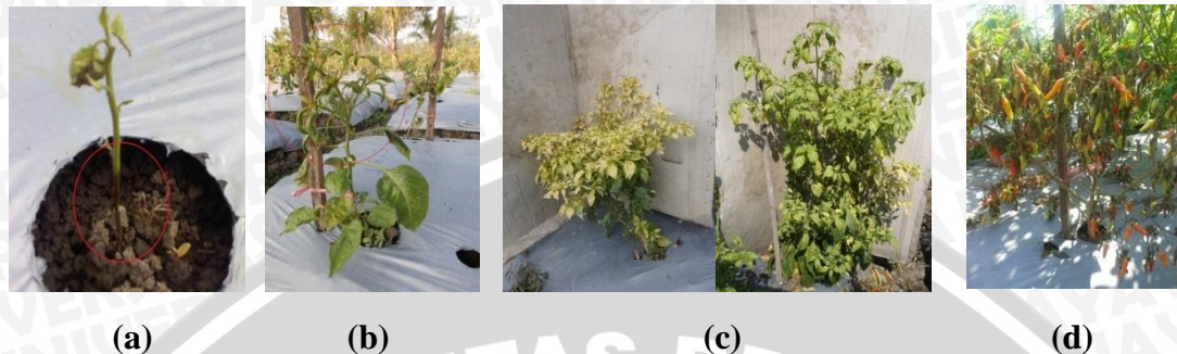
Gambar 10. Penyakit yang menyerang tanaman cabai rawit (a) rebah batang, (b) keriting, (c) Kuning dan hijau keriting, (d) Layu fusarium

yang terserang penyakit, kemudian membuang jauh dari lahan pertanaman. Secara mekanik dengan menggunakan insektisida, pestisida, dan fungisida.