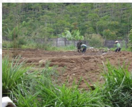
Pembentukan Guludan Pada Lahan Penelitian