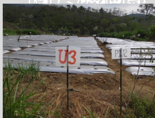
Pemasangan Mulsa Pada Tiap Ulangan