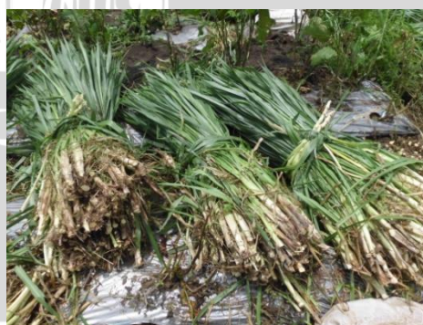
Gambar 4. Panen atau Pemetongan Rumput Gajah yang Kedua