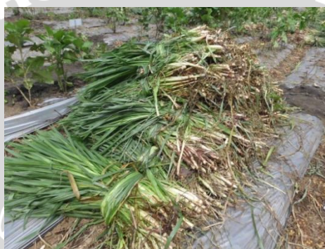
Gambar 5. Panen atau Pemotongan Rumput Gajah yang Kedua