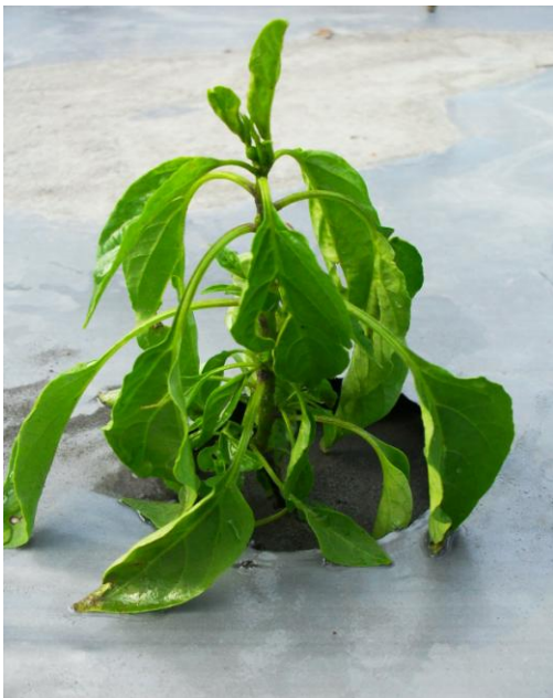
Gambar 12. Tanaman terserang layu bakteri disertai kekerdilan