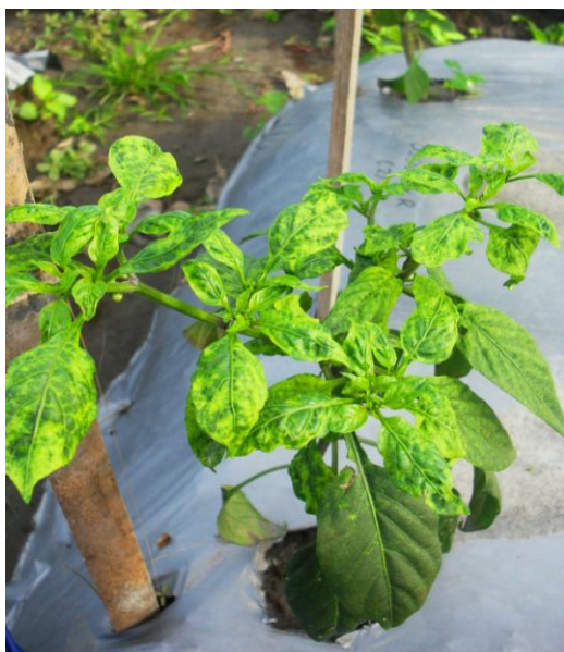
Gambar 14. Tanaman terserang Geminivirus