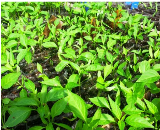
Gambar 2. Tanaman saat persemaian