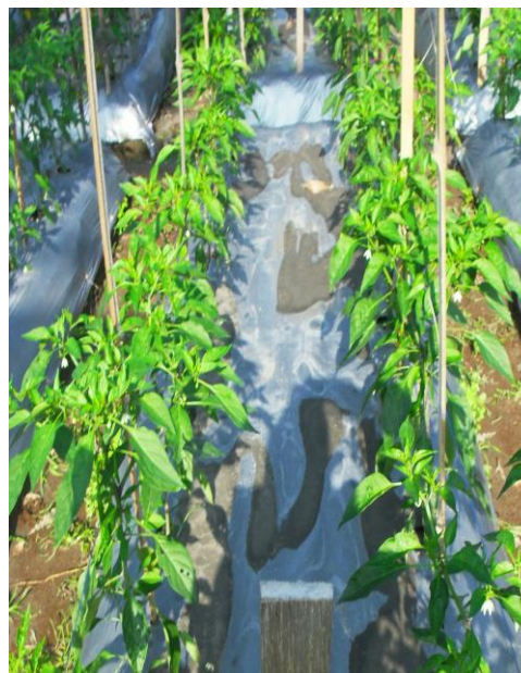
Gambar 3. Petak Populasi F 2