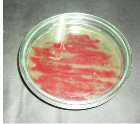
Gambar 11. Koloni R. solanacearum pada media TZC