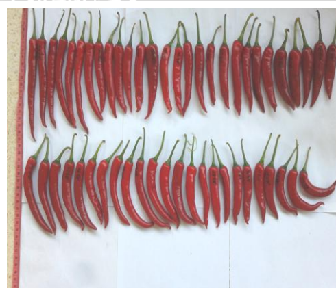
Gambar 17. Hasil buah cabai besar yang dipanen