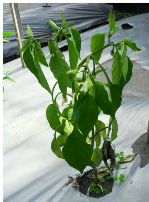
Gambar 9. Seluruh tanaman terserang layu bakteri