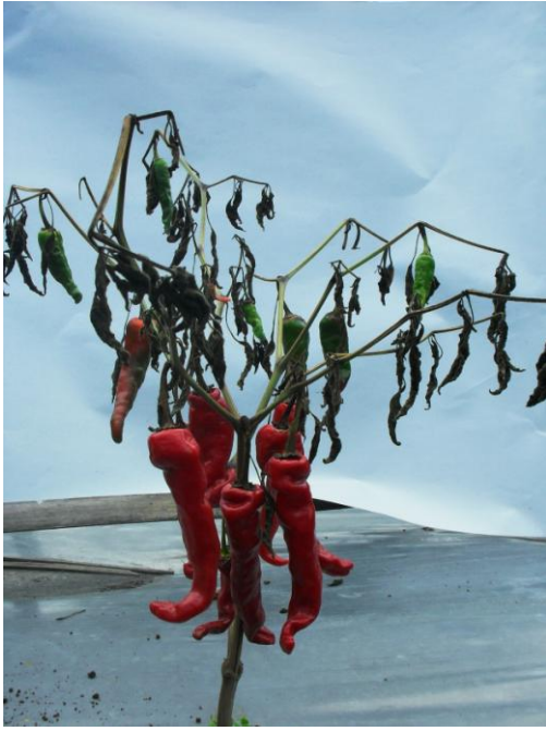
Gambar 10. Tanaman terserang layu bakteri