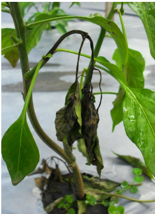
Gambar 8. Daun muda yang terserang layu bakteri