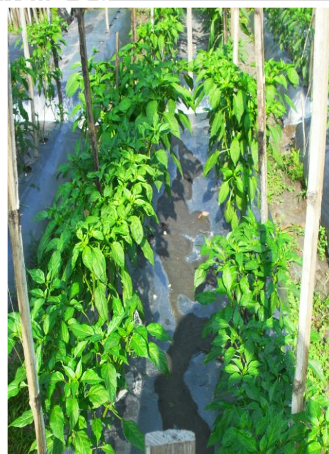
Gambar 5. Petak Populasi Tetua