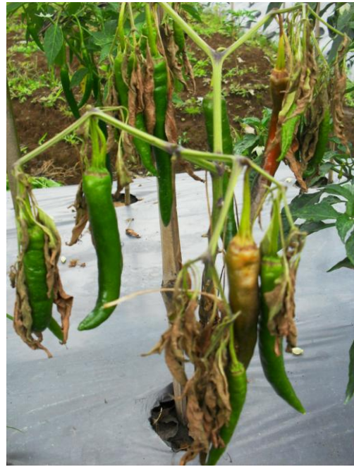
Gambar 7. Serangan layu bakteri saat stase pemuahan