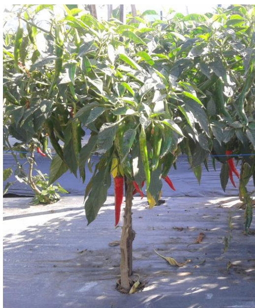
Gambar 16. Tanaman saat memasuki umur panen