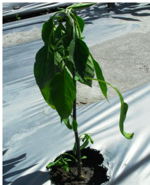
Gambar 15. Tanaman terserang layu Fusarium oxysporum