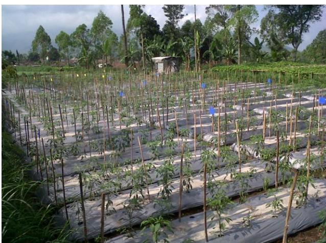
Gambar 4. Populasi F 2 , Jatilaba, PBC 473, Randu dan 02094