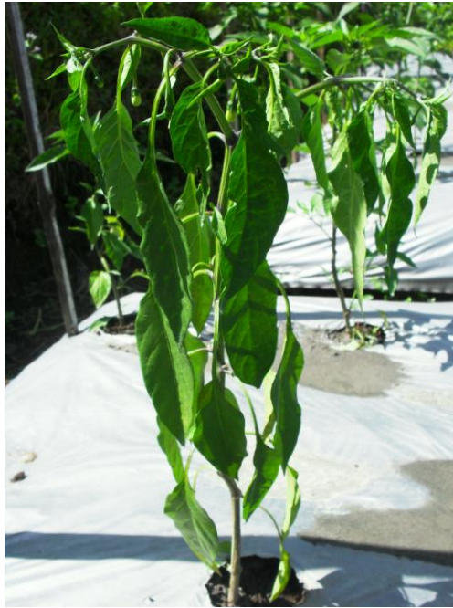
Gambar 6. Serangan layu bakteri saat tanaman memasuki awal stase pembungaan