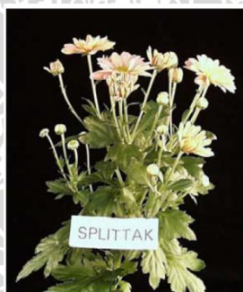
Gambar 3. Tanaman krisan dengan pertumbuhan bunga yang tidak seragam akibat interupsi cahaya di antara fase gelap pada periode hari pendek (Budiarto dkk, 2006).

Sehubungan dengan sensitifitas tanaman krisan terhadap cahaya, keberadaan cahaya di antara fase gelap ini pun perlu mendapat perhatian. Keberadaan terang (cahaya) di antara fase gelap selama induksi pembungaan (hari pendek) akan mempengaruhi pertumbuhan bunga. Cabang baru bunga akan tumbuh dengan waktu yang tidak bersamaan dan muncul dari segmen tanaman bagian tengah atau bawah tanaman ( over branching ) seperti disajikan pada Gambar 3. Selain akan mempengaruhi pertumbuhan dan perkembangan bunga yang muncul dari perubahan pertumbuhan apikal, kemunculan bakal bunga ini dapat mengurangi bentuk dan mutu fisik bunga potong (Maaswinkel dan Sulyo, 2004).