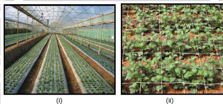
Gambar 5. (i) Pertanaman tanaman induk dalam rumah kaca dengan menggunakan mulsa dan (ii) tanaman induk tanpa mulsa dalam rumah plastik (Maaswinkel dan Sulyo, 2004).

Budidaya tanaman induk dilakukan dalam rumah lindung yang terpisah dengan pertanaman untuk produksi bunga. Pertanaman induk dapat menggunakan mulsa plastik untuk mengurangi pertumbuhan gulma yang cepat (Gambar 5). Mulsa ini juga berfungsi untuk menjaga kestabilan sifat fisik dan kimia tanah pada lahan bedengan selama proses pertanaman (Budiarto dkk, 2006).