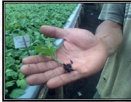
Gambar 1. Potongan stek dengan ukuran 5 – 7 cm dapat digunakan sebagai bahan tanam setelah melalui proses pengakaran stek (Budiarto, 2006)