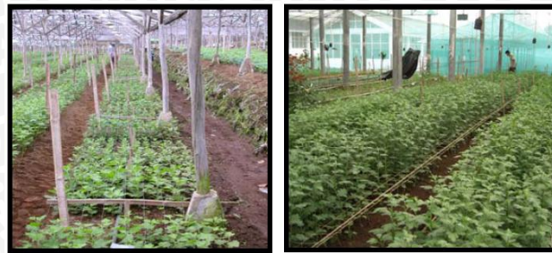
Gambar 4. (a) jaring penegak tanaman dipasang pada saat tanaman masih muda/sebelum tanam dan, (b) secara bertahap dinaikkan untuk menjaga tegaknya tanaman (Budiarto dkk, 2006).

dan digunakan untuk musim tanam/penanaman berikutnya (Budiarto dkk, 2006).