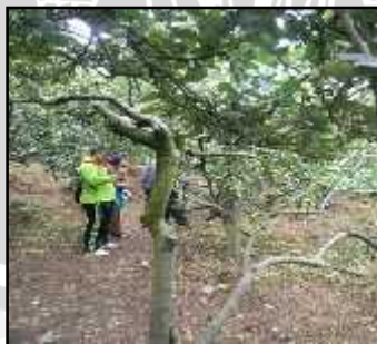
Kegiatan Agrowisata Petik Apel dalam Kebun UNIVERSITAS BRAWIJAYA