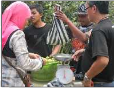
Proses Jual Beli Setelah Kegiatan Wisata Berlangsung