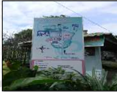
Peta Lokasi obyek wisata dalam Desa Wisata Tulungrejo.