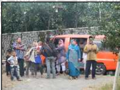
Kedatangan Wisatawan Menggunakan Kendaraan Wisata/ Shuttle