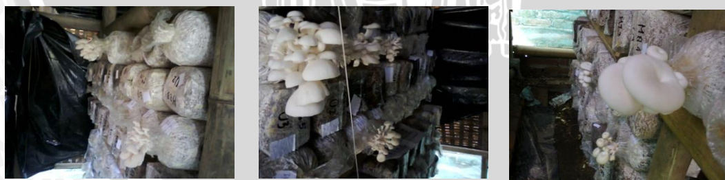
a b c

Keterangan : a. Penataan baglog tampak depan. b. Penataan baglog tampak sisi kanan rak percobaan. c. Penataan baglog tampak sisi kiri rak percobaan.