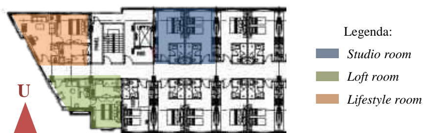
Gambar 3.1 Ruang Kamar yang diukur

Penentuan bilik kamar yang akan di ukur diputuskan melalui analisis kondisi bangunan. Kamar yang terpilih ditentukan dari faktor-faktor yang mempengaruhi kenyamanan termal dalam bangunan. Dalam penelitian ini, kamar yang akan dijadikan kajian utama yaitu suite room yang menghadap ke arah barat. Ruangan ini berada di tiap lantai hotel dari lantai 2-8 yang akan di ukur di tiap lantainya. Selain kamar pada sisi barat, diperlukan juga pengukuran suhu pada sisi utara dan selatan sebagai data perbandingan. Untuk mempermudah, pada sisi utara dan selatan diambil 1 titik kamar saja yang akan di asumsikan memiliki kualitas dan kondisi yang sama rata dengan kamar di sepanjang sisi dengan pertimbangan ukuran ruang yang sama.