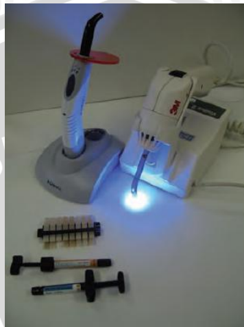
Gambar 2.2 Resin komposit light cured dan light curing unit (Mc Cabe, 2008)

Metode penggabungan kedua bahan ini juga dapat menimbulkan terbentuknya gelembung oksigen di dalam tumpatan, waktu manipulasi yang singkat juga meningkatkan terbentuknya gelembung oksigen yang terperangkap di dalam tumpatan saat polimerisasi (Anusavice, 2004).