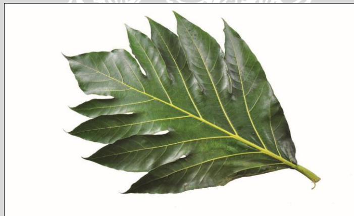
Gambar 2.2. Daun Sukun

Pohon sukun ( Artocarpus altilis ) adalah tumbuhan jenis nangka, dengan pohon yang relative besar dan tinggi mencapai 30 meter.