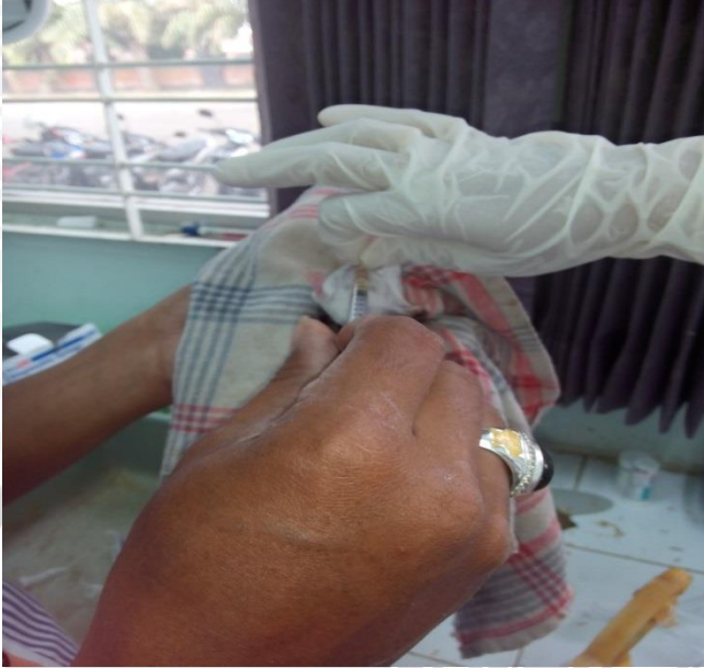
Proses pengambilan urin untuk diukur albumin