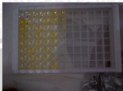
Hasil kadar TNF- \alpha serum setelah di cek menggunakan metode ELISA