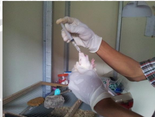
Pemberian endosulfan pada tikus secara oral