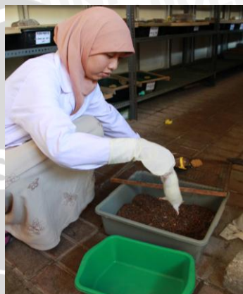
Pemberian makan dan penggantian sekam tikus di lab. Fisiologi FKUB