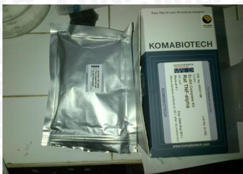
ELISA kit Rat TNF- \alpha