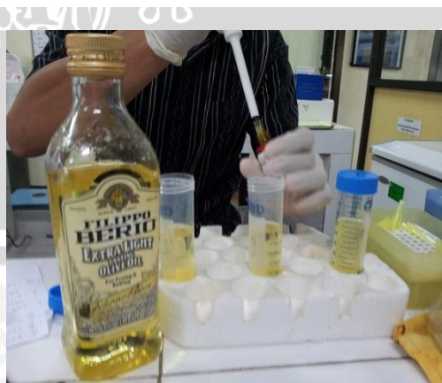
Pembuatan sonde endosulfan