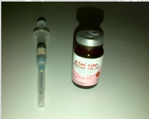
Euthanasia pada tikus yang akan dibedah menggunakan ketamin