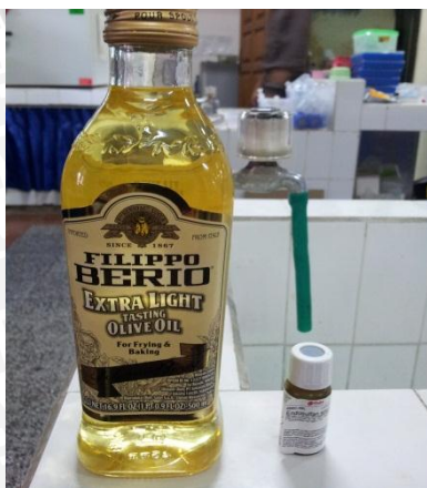
Minyak zaitun dan Endosulfan