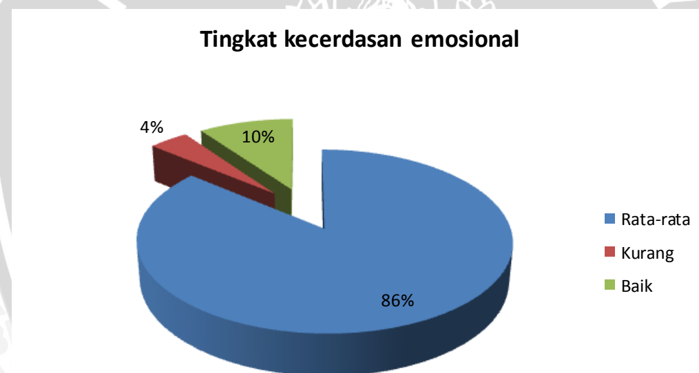
Gambar 5.2. Distribusi Persentase Tingkat kecerdasan emosional pada remaja putri di SMAN 4 Blitar

Berdasarkan data hasil penelitian tingkat kecerdasan emosional di SMAN 4 Blitar didapatkan hasil bahwa 86% yaitu 105 responden memiliki tingkat kecerdasan emosional rata-rata.